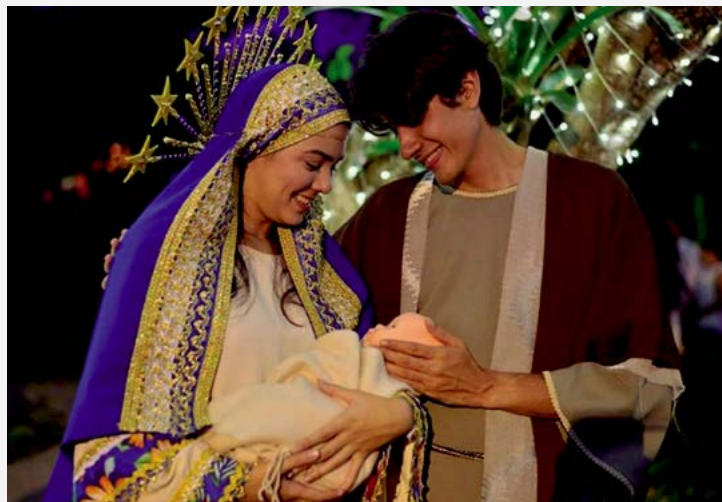
ARCOVERDE Programação conta com mensagem do nascimento de Cristo

conta ainda com shows, teatro, trilhas e a chegada do Papai Noel, que acontece de maneira original, em um carro de boi, ao som da banda de pífanos, com o tradicional “Noite Feliz”. Com acesso gratuito, o público ainda conta com uma logística de ônibus no município, em horários e pontos especiais, para garantir a presença no espetáculo. Mais informações através dos telefones (87) 3822-2828/3821-2764.