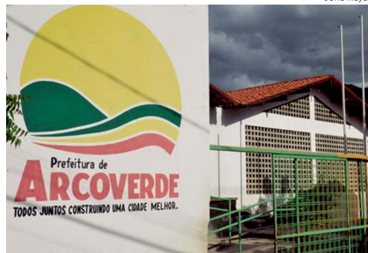
Prioridade é para estudantes que já são da rede