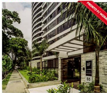
Jaqueira - 4 suítes, terraço, piscina, playground, área verde com árvores centenárias preservadas