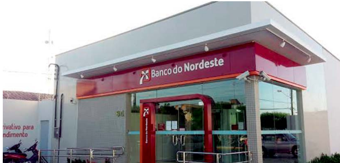
Acordo deve beneficiar empreendedores de aproximadamente mil municípios

Instituições firmaram acordo a fim de ampliar pequenos negócios em todos os estados do Nordeste e em outras regiões do país