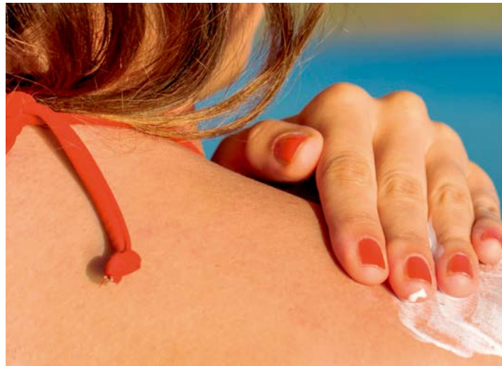
Cuidados diários ajudam na prevenção do câncer de pele

Desde 2014, a Sociedade Brasileira de Dermatologia (SBD) promove o chamado “Dezembro Laranja”, ação que faz parte da Campanha Nacional de Prevenção ao Câncer de Pele, e, desde então, o mês de dezembro é dedicado para a realização de diferentes ações. “Se faz necessário levar conhecimento a toda população, para que todos estejam atentos aos sinais e sintomas, objetivando uma detecção precoce, trazendo mais chances de cura, como também diminuir o risco de morte. Quanto mais informação e mudanças de hábitos, menores serão os índices desta doença”, explica a enfermeira de educação continuada