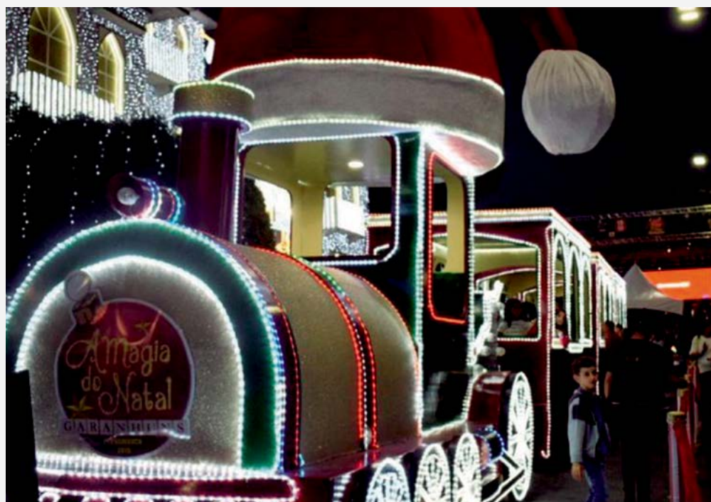
GARANHUNS Cidade recebe turistas de várias regiões