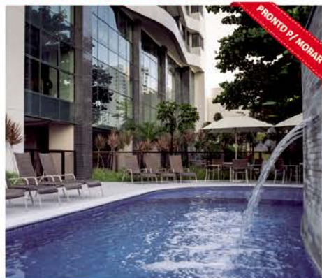
Boa Viagem - 2, 3 e 4 QTs (1 ou 2 suítes), área de lazer com piscina, playground, espaço de pilates e mais