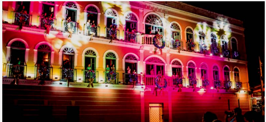
TRIUNFO Programação conta com parceria da Prefeitura, SESC e Governo do Estado

consciência sobre a cidadania. O projeto está visitando os bairros do município, expondo trabalhos realizados pelos estudantes. Todo valor arrecadado através de material produzido pelos alunos que for comercializado, será direcionado para alguma ação que ajude as escolas. A campanha de Petrolina ainda vai realizar um sorteio de 01 carro e 04 motos zero quilômetro, além de eletrônicos.