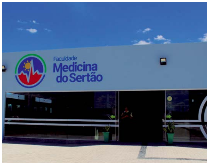
Prédio está construído às margens da BR-232