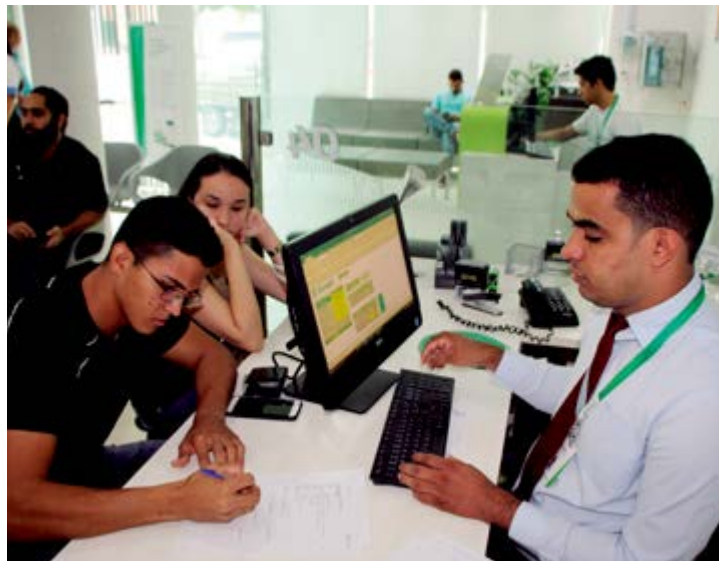
Crescimento do cooperativismo em Petrolina se destaca

Segundo a empresa, já no segundo ano de funcionamento, a cooperativa superou momentos críticos da economia nacional. Mas, apesar do cenário, a empresa se manteve estável e continuou a garantir aos associados taxas atrativas de captação e empréstimo. “Geramos um grande benefício em áreas como agropecuária, imobiliária e saúde privada, ajudando no crescimento da região, gerando, inclusive, emprego e renda”, aponta o