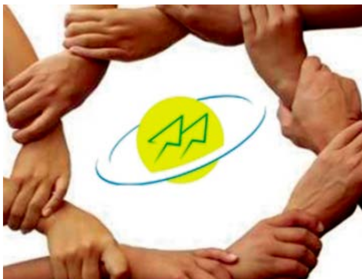
Empresa te acompanhado o desenvolvimento da região

Hoje, o Sicredi Vale do São Francisco atua na linha de investimentos, crédito, cartões, seguros, consórcios, previdência e consignado, e possui mais de 4 mil associados, fazendo parte de um sistema nacional que reúne 3,7 milhões de pessoas a partir de 1.575 agências distribuídas em 21 estados do país. Na região, a instituição atende aos municípios Petrolina, Afrânio, Lagoa Grande, Santa Maria da Boa Vista, em Pernambuco; e Juazeiro, Jaguarari e Senhor do Bonfim, na Bahia.