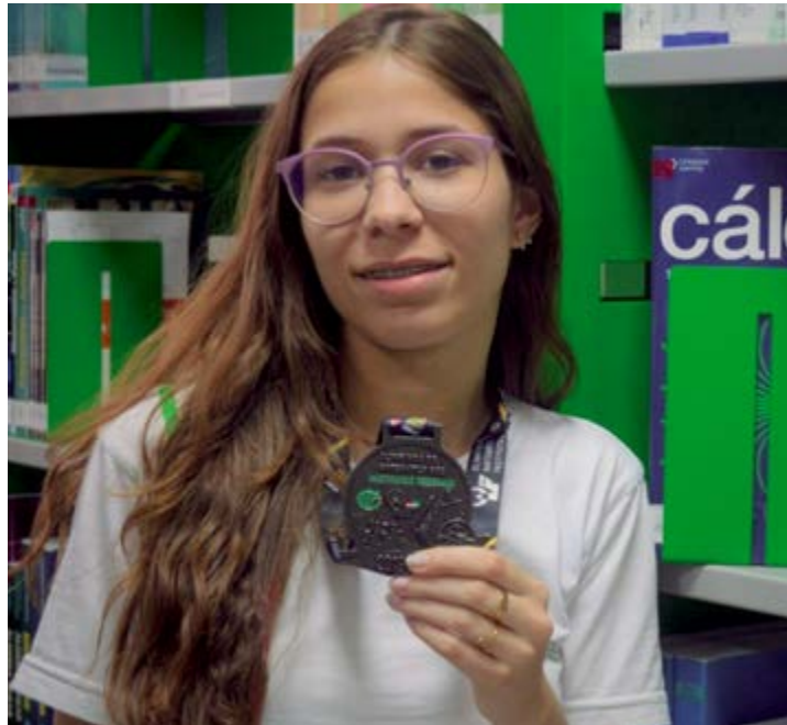
Estudante recebeu medalha ao participar da competição pela primeira vez