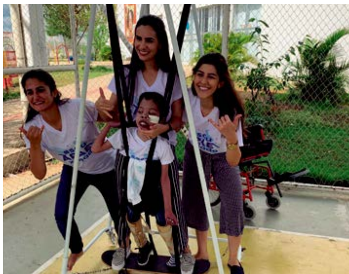
Instituição atua com projetos voltados para as mais diversas fases

Dos 60 aos 90 anos, a Associação auxilia portadores de deficiência em suas diversas fases através dos setores de estimulação precoce e de envelhecimento. Quem opta por procurar a unidade encontra atendimentos de saúde, assistência social e apoio pedagógico. “Nós já estamos trabalhando com a capacidade máxima, nossa expectativa é expandir a sede da APAE, para que assim possamos aumentar o número de serviços”, completa o coordenador, que lembra que a captação de recursos foi