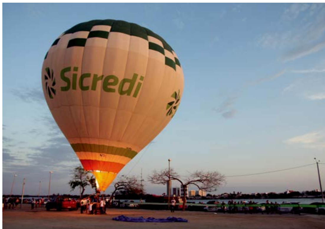
Foram realizados diversos voos ao longo da tarde

Uma experiência inédita e inesquecível com direito a uma visão privilegiada de Petrolina a bordo de um balão de ar quente. Foi assim, literalmente a 20 metros de altura, que um grupo de associados e convidados do Sicredi Vale do São Francisco, comemorou no último dia 29 de outubro, na orla do município, o Dia Internacional das Cooperativas de Crédito (DICC). Sob as condições climáticas favoráveis, ou seja, ausência de chuva e de vento superior a 18km/h, a iniciativa co-