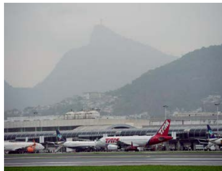
Avião na pista do Aeroporto Santos Dumont após reforma

Tarcísio também abordou o programa de concessão dos aeroportos da Infraero, que deverão passar para o controle da iniciativa privada até 2022. O ministro explicou que existe um cronograma de concessões e que ele está sendo seguido à risca. “O próximo passo é fazer o leilão, em outubro do ano que vem, de 22 aeroportos. São três blocos: o Norte 1, o Centro e o Sul. A partir do momento em que a gente faz o leilão, inicia a estruturação da sétima e última rodada, com mais 19 aeroportos, em três blocos, aí sim [incluindo] Congonhas e