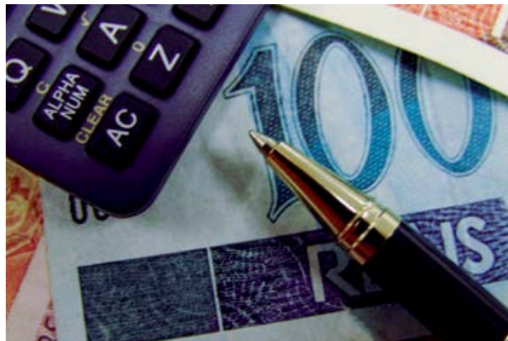
SALÁRIO MÍNIMO Valor anunciado para 2020 é menor que o previsto

Até o ano passado, a política de reajuste do salário mínimo, aprovada em lei, previa uma correção pela inflação mais a variação do Produto Interno Bruto (PIB, soma dos bens e serviços produzidos no país). Esse modelo vigorou entre 2011 e 2019. Porém, nem sempre houve aumento real nesse período porque o PIB do país, em 2015 e 2016, registrou retração, com queda de 7% nos acumulados desses dois anos. O valor previsto agora está abaixo da última projeção, anunciada em abril, que indicou um salário mínimo de R$ 1.040. A revisão para baixo está relacionada à correção do valor do salário mínimo de 2020 ser corrigido pela inflação desse ano, medida pelo Índice Nacional de Preços ao Consumo