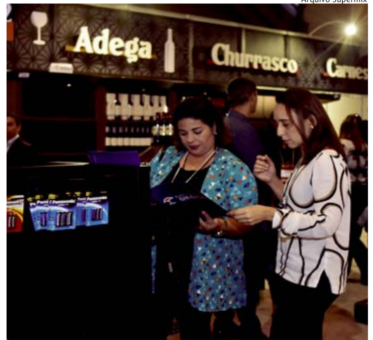
SUPER MIX Feira traz novidades para os clientes

Ainda na estrutura da loja planejada, estará exposto o self-checkout, um terminal