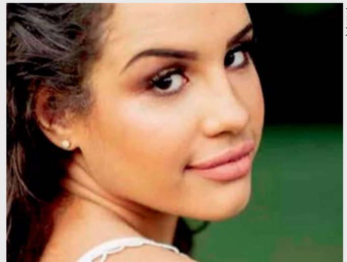
Blogueira Alinne Araujo cometeu suicídio após ataque nas redes sociais