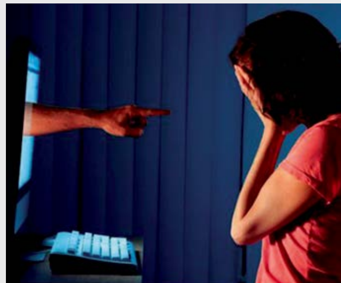
Cyberbullying é um dos grandes vilões