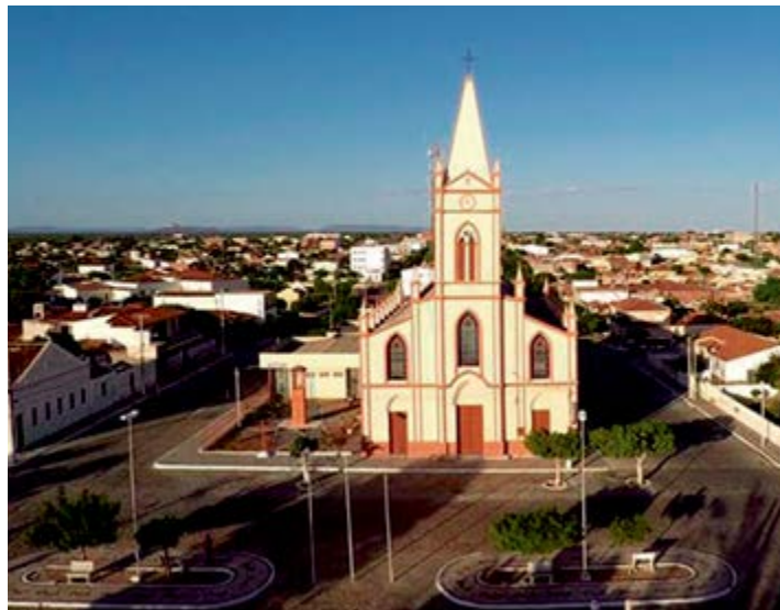
Ministério do Turismo vai trabalhar o município entre 2019 e 2021

do Brasil, que viram suas histórias difundidas nacionalmente e internacionalmente, teve papel importante para que a cidade passasse a fazer parte do mapa. Além da referência, outros fatores que contribuíram para a inclusão de Belém do São Francisco na relação foram a criação da Secretaria Municipal de Turismo e Desenvolvimento Econômico e também o Conselho Municipal de Turismo (COMTUR). Com a criação desses dois importantes órgãos e ações como a criação da Lei Municipal que rege o turismo local, Fundo Municipal de Turismo, elaboração de rotas teste, encontros de experiências turísticas, entre outros, foram fundamentais no processo que consolidou