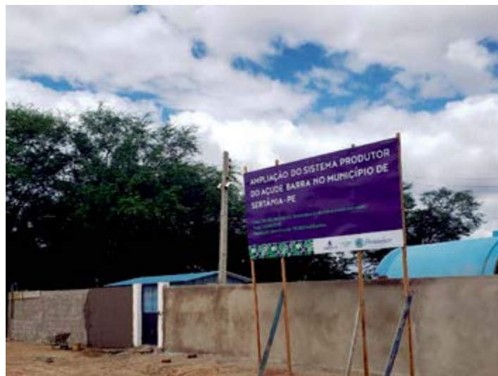
Obras devem estar concluídas em novembro

As comunidades de Barreiros, Cacimbinha, Maia, Salgadinho, Salgado, Santa Maria, São Gonçalo, Waldemar Siqueira e Xique-Xique, também serão contempladas com obras que proporcionarão melhorias hídricas, a partir de serviços que dizem respeito a uma