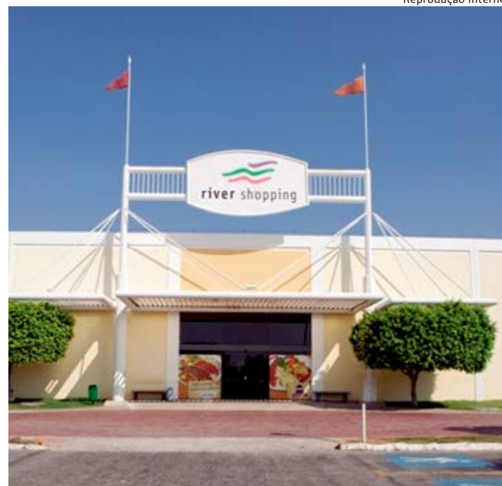
No Sertão pernambucano, Petrolina foi a primeira a contar com um shopping center