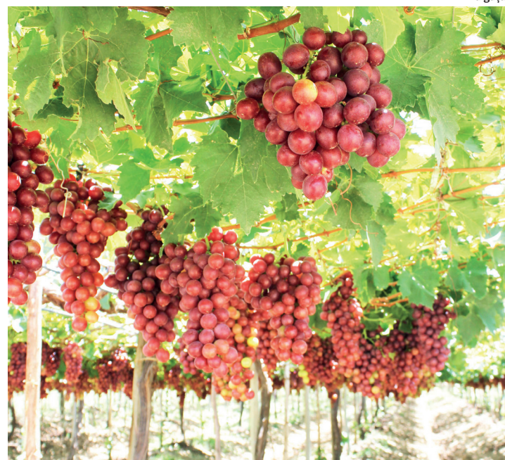
Ministra quer investir na produção de uvas da região do Vale do São Francisco