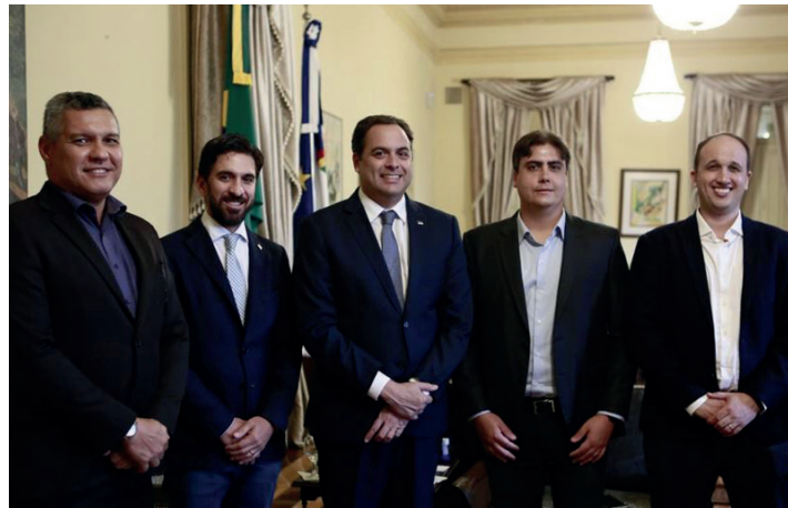
Representantes do Novo e da AD Diper reuniram-se com o Governador

● A partir do próximo mês de agosto, Pernambuco vai receber quatro lojas da rede de atacarejo Novo – Atacado e Varejo. A empresa anunciou recentemente que pretende investir cerca de R$ 500 milhões, nos próximos quatro anos, que serão aplicados na abertura de até 20 lojas em solo pernambucano. Apenas para 2019, a expectativa é de gerar um total de 4,5 mil empregos, sendo 1,5 mil empregos diretos, beneficiando, principalmente, a população local. A marca, que nasce 100% pernambucana, é recém-criada pelos grupos varejistas de origem mineira SFA e Super Cidades e deve investir nesse primeiro momento R$ 120 milhões para a abertura das primeiras unidades, sendo a primeira em Carpina, no mês de agosto, seguida por Vitória de Santo Antão e Arcoverde, em setembro e outubro, respectivamente. É uma nova rede de lojas que chega con-