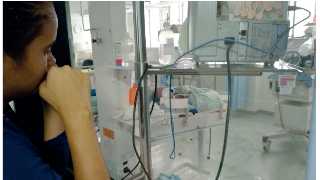
ESPERANÇA Do outro lado do vidro, uma mãe que sonha com o filho nos braços