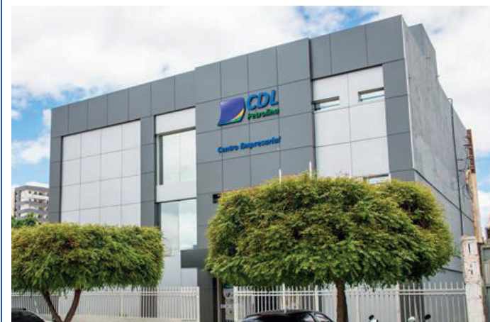
Sede da CDL Petrolina

Também faz parte da nossa missão, apoiar o setor de comércio, indústria, e serviços, através da oferta de serviços de suporte na gestão e vendas, atendendo nossos associados com colaboradores treinados e com serviços rápidos e diferenciados, contribuindo assim para o desenvolvimento econômico e socioambiental.