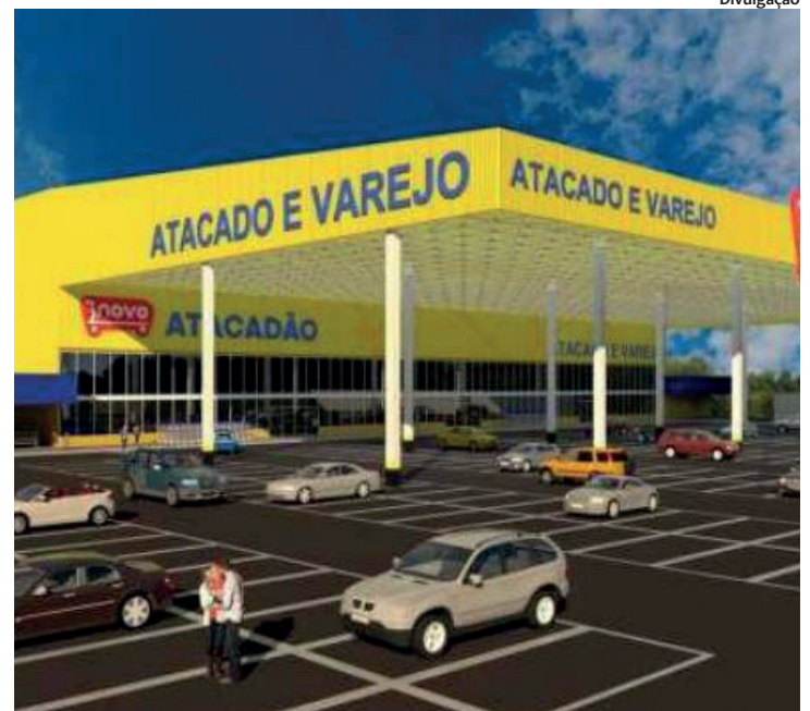
Apenas em 2019, rede pretende investir R$ 120 milhões, em quatro lojas

Carpina e Vitória de Santo Antão já iniciadas. Prometendo menor preço da cidade, o Novo vai ofertar um mix inicial com 8 mil itens, entre alimentos, não perecíveis, artigos de higiene, limpeza, automotivo, bomboniere, bebidas, entre outros produtos. A aposta é no conceito de feiras livres nos seus supermercados, que contarão ainda com padaria e açougue, reunindo-se, assim, com a cadeia produtora local. “Vamos apresentar