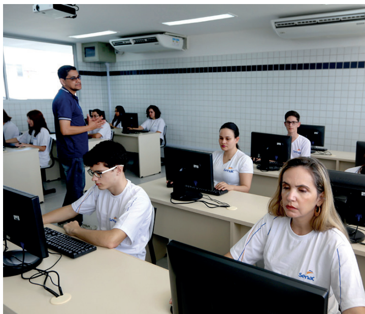
Projeto foi apresentado no mês de abril

No local, serão oferecidos o Programa de Aprendizagem, cursos de capacitação, qualificação, aperfeiçoamento, técnicos, superiores e de pós-graduação. Cabeleireiro, Maquiador, Recepcionista de Consultório Odontológico, Representante Comercial, Vendedor, Atendente de Lanchonete, Cozinheiro, Sushiman, Instalador e Reparador de Redes de Computadores; Técni-