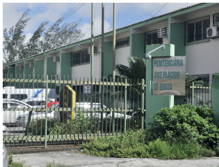
Detentos da penitenciária de Caruaru receberão formação técnica à distância

Esse será o primeiro curso técnico à distância para detentos que já concluíram o Ensino Médio. “A unidade prisional dispõe de uma escola que forma os detentos no ensino médio, na modalidade EJA (educação para jovens e adultos), e os próprios detentos estavam demandando uma formação pós ensino médio, fosse técnico ou superior. Então a nossa escolha pelo curso à distância foi justamente oferecer uma oportunidade de empreender na hora do egresso desse detento. Com o curso, ele não vai precisar depender de ninguém para conseguir um emprego, tendo autonomia para trabalhar sozinho, pois sabemos que um dos maiores problemas da ressocialização é a dificuldade de reinserção no mercado de