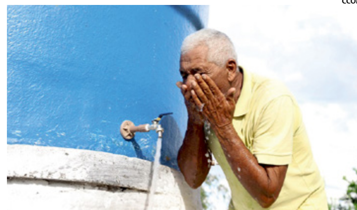
Poços beneficiam mais de 100 famílias