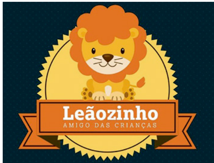
Iniciativa pode destinar até 3% para FEDCA

Essa ação solidária, que é uma parceria entre a Receita Federal e o Conselho Estadual de Defesa dos Direitos da Criança e do Adolescente (CEDCA), não ocasiona nenhum custo extra ao contribuinte. Caso não haja nenhum valor a pagar, e sim a restituir, a doação vigora como parcela dedutível. Ou seja, oferece a livre escolha sobre o destino de parte desses tributos pagos anualmente à União e ainda acresce no valor a ser restitu-