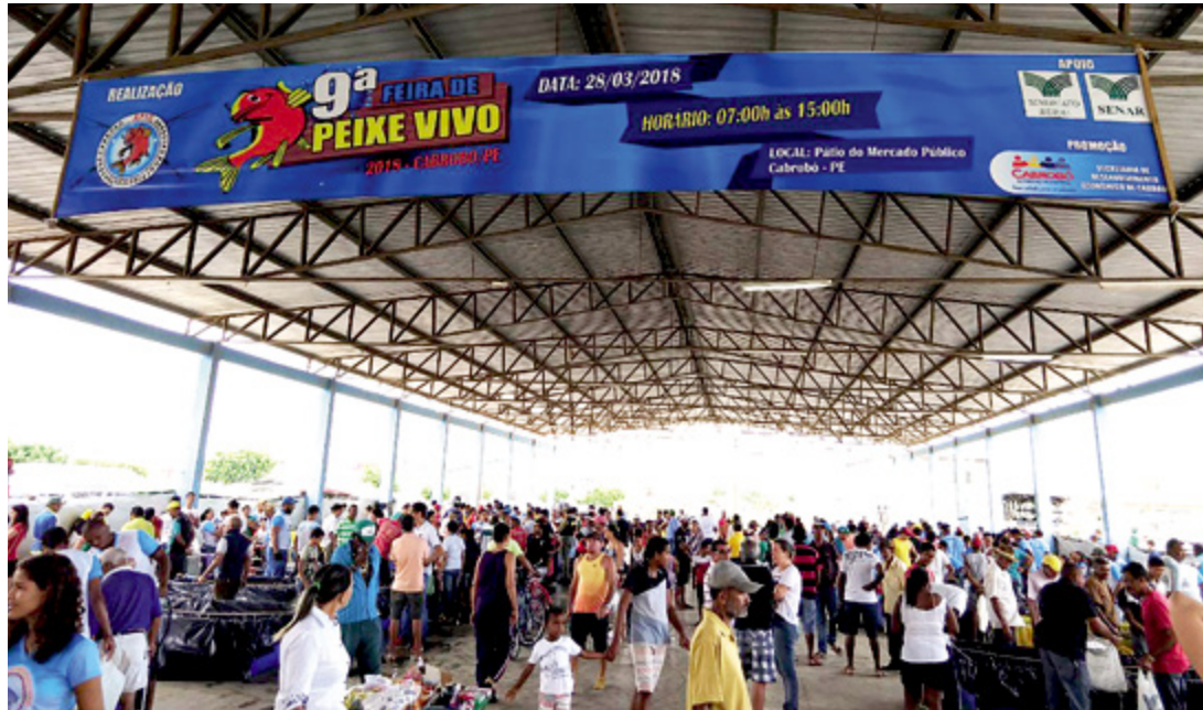
PEIXE VIVO Expectativa é atrair 5 mil pessoas e comercializar até 12 toneladas de peixe