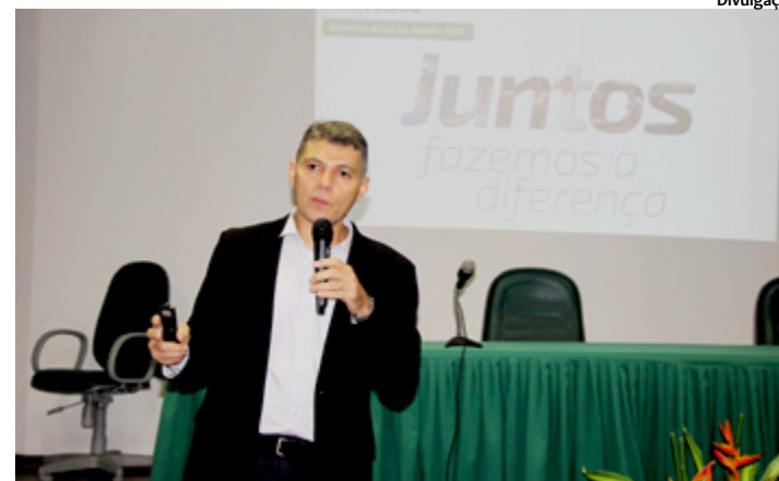
Anúncio foi feito pelo presidente Antônio Vinicius durante assembleia geral