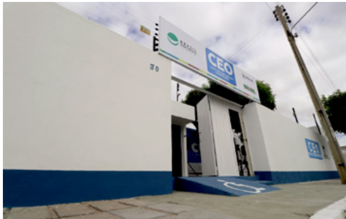
Unidade oferta ainda serviços de ortodontia preventiva

Com a abertura do CEO da Vila Mocó, os petrolinenses contam com um aumento em mais de três mil procedimentos por dia, elevando a capacidade do município para 26 mil em toda a rede