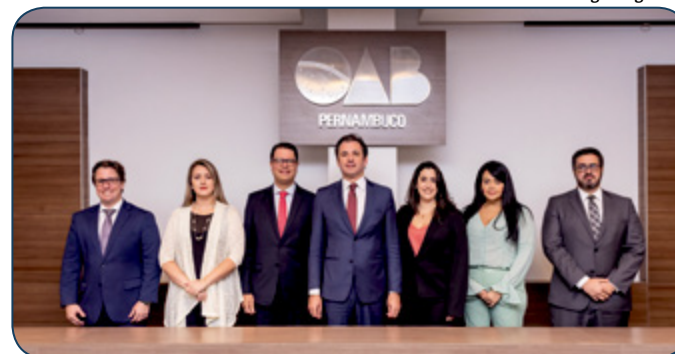
Nova diretoria da CAAPE para o triênio 2019-2021