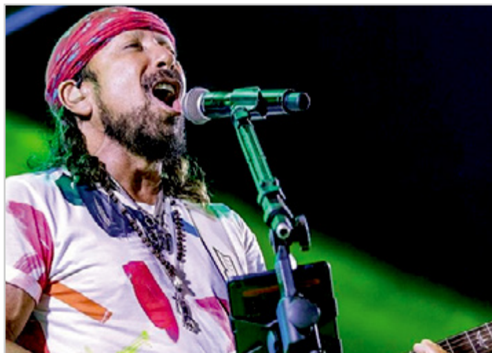
Bell Marques é uma das atrações do Baile Municipal

Outra prévia aguardada acontece no dia 17 de fevereiro, a partir das 13h, o bloco “Vai que é tua Tafarel”. A