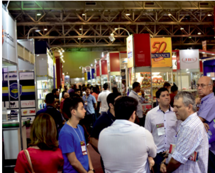
Feira é maior dos setores atacadista e supermercadista do NO e NE