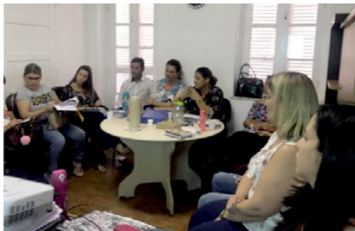
Reuniões com os grupos são realizadas uma vez por semana

A Secretária de Saúde da Prefeitura de Arcoverde, dando início ao ciclo de atividades de 2019, promoveu o primeiro Colegiado de Gestão, a partir da proposta de criação de um espaço voltado para práticas solidárias e dialógicas. O objetivo é construir consensos, ampliando a democratização da gestão e a autonomia das equipes de Saúde da Família.