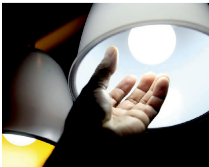
O consumidor fique atento para evitar gastos elevados de energia elétrica

■ A Agência Nacional de Energia Elétrica (Aneel) informou no último dia 28 que vai manter a cobrança extra na conta de luz no patamar mais alto em outubro. Desde junho, as contas de luz estão na bandeira vermelha, patamar 2, o que acarreta cobrança extra de R$ 5 a cada 100 quilowatts-hora (kWh) consumidos. Segundo a agência, a cobrança será mantida porque ainda são desfavoráveis as condições hidrológicas e por causa da queda no nível de armazenamento dos principais reservatórios do Sistema Interligado Nacional (SIN). De acordo com a Aneel, apesar da queda do Preço de Liquidação de Diferenças (PLD), o cenário hidrológico foi desfavorável e não se vislumbrou melhora significativa do risco hidrológico (GSF, na sigla em inglês). "O GSF e o PLD são as duas variáveis que determinam a cor da bandeira a ser acionada", informou a agência. Nos quatro primeiros meses do ano, vigorou a bandeira verde, sem cobrança extra na conta de luz. Em maio, vigorou a bandeira tarifária amarela, em que há adicional de R$ 1 na conta de energia do consumidor a cada 100 kWh consumidos. Em junho, quando decidiu adotar a bandeira vermelha no patamar 2, a Aneel disse que a decisão foi