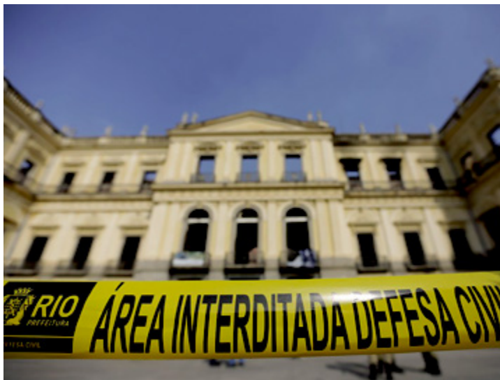
O prédio do Museu Nacional está interditado desde o incêndio no início de setembro

Os recursos serão repassados no âmbito da Lei Federal de Incentivo à Cultura, também conhecida como Lei Rouanet. Isso significa que os projetos contemplados deve-