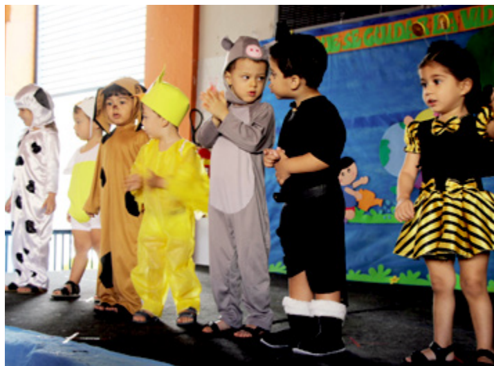
O objetivo do projeto foi trabalhar temas que relacionam a cidadania

Uma coreografia baseada no filme 'O Lorax - Em Busca da Trúfula Perdida' (2012), dos diretores Chris Renaud e Kyle Balda trouxe em destaque a problemática da carência de sustentabilidade no processo de desenvolvimento dos municípios do interior do estado. Outra turma, caracterizada de tartarugas, leões, aves, abelhas e vaquinhas, explicou aos pais como seria o mundo para os humanos sem a água potável, e foi sucedida por alunos que falaram sobre os animais, alimentação saudável, higiene pessoal, dentre outras