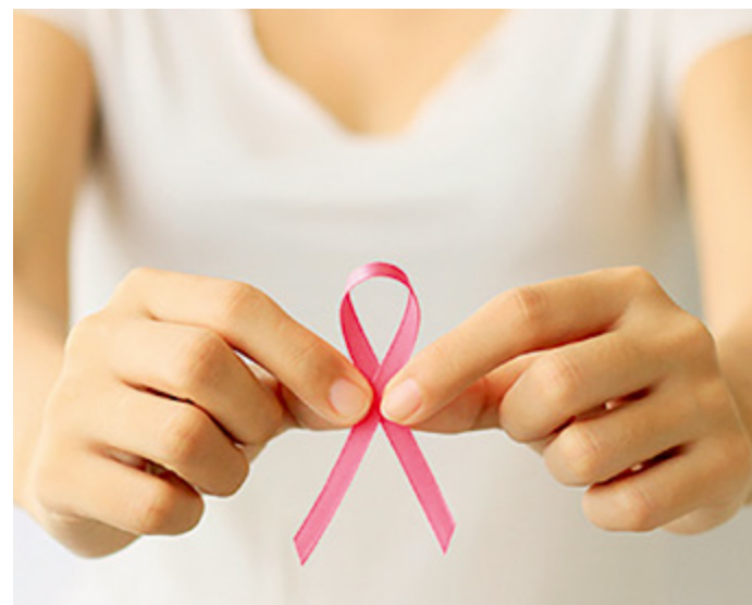
Estão previstos até o fim deste ano, mais de 59 mil casos de câncer de mama