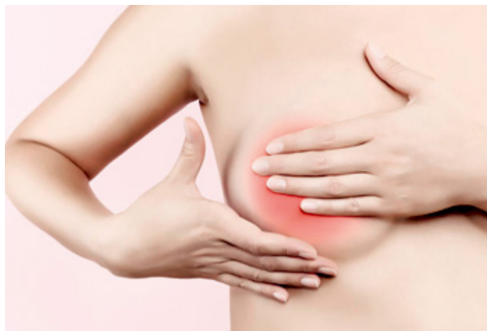
A mulher deve ficar atenta aos sinais que o corpo dá e realizar o autoexame de mama