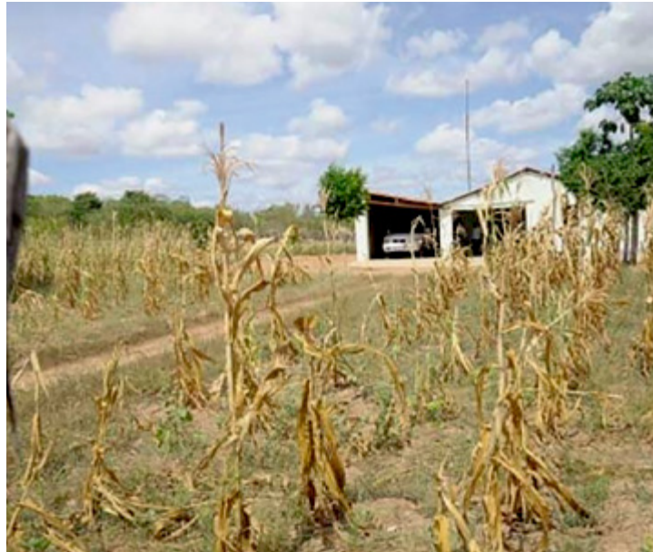
A estiagem tem causado perdas aos agricultores sertanejos

Os municípios que estão em situação de emergência são os seguintes: Afogados da Ingazeira, Afrânio, Araripina, Arcoverde, Belém do São