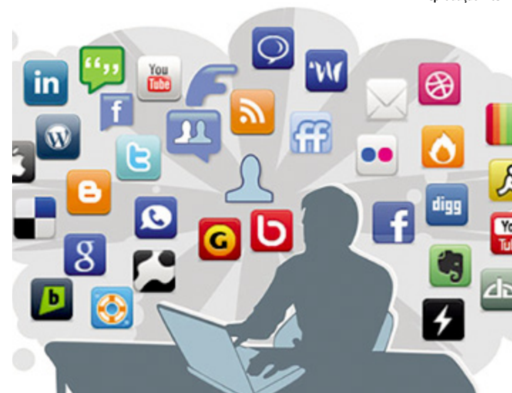
Em 2018 o eleitor foi mais ativo militando na internet

“Há uma conjuntura muito específica nesta eleição. Temos um eleitor desanimado com a política, descrente das instituições, com a imagem da política