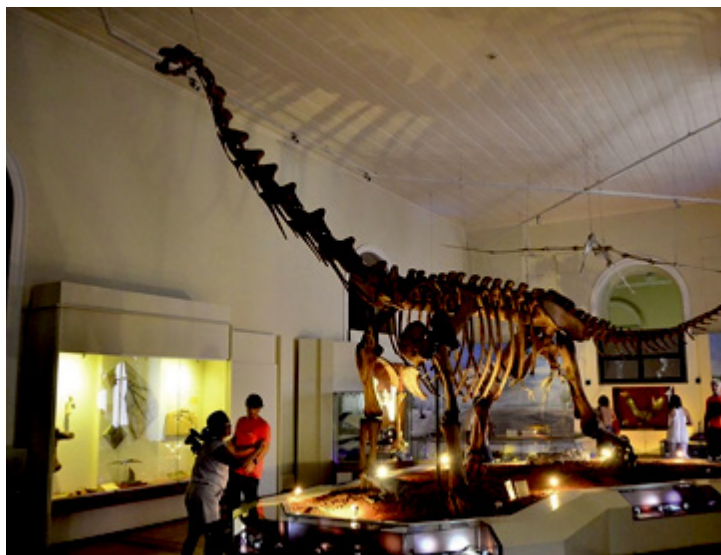
Registro do interior do Museu Nacional antes do incêndio atingir o local

Cada proponente contemplado poderá receber no máximo R$ 4 milhões, sendo que o gasto com a etapa de elaboração de projeto executivo não poderá ser superior a R$ 1 milhão. Uma vez aprovada, a proposta terá inicialmente o prazo de 36 meses para execução, podendo haver prorrogação a critério do BNDES. Os requisitos para participar do certame foram elaborados com base na Portaria 366 do Iphan, que foi editada no mês passado e traz diretrizes para projetos de prevenção e combate ao incêndio e pânico em bens edificados tombados. Uma comissão de mérito analisará a abrangência e a representatividade do acervo, além da urgência das intervenções pleiteadas. A proposta também passará pelo crivo de uma comissão técnica, que avaliará a sua exequibilidade e a capacidade de gestão do proponente. JS