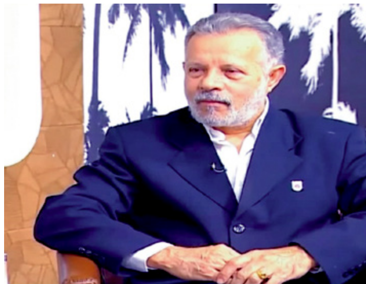
Foi possibilitado o uso de uma ferramenta que inclui técnicas comportamentais