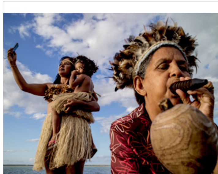
Povo Tuxá - Rodelas/BA

As melhores fotos escolhidas pela curadoria serão premiadas