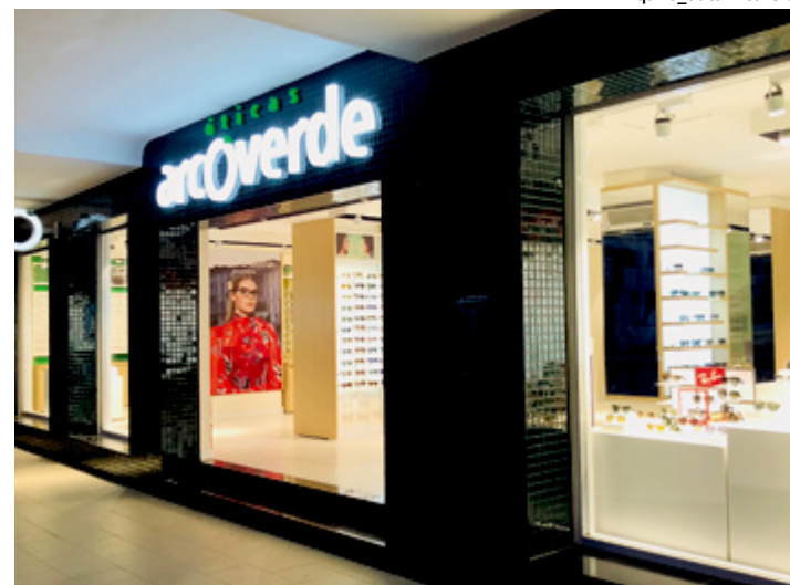
O espaço foi projetado pelo escritório de arquitetura Maurício Queiroz