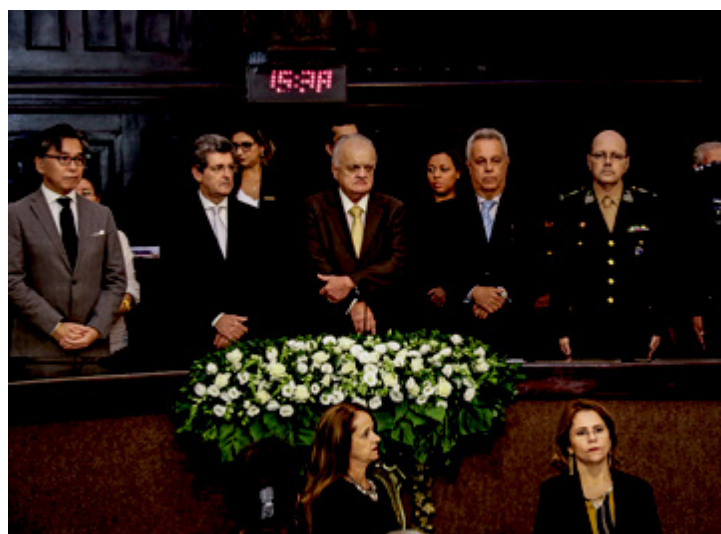
Como presidente da casa ele comandou a construção da nova sede