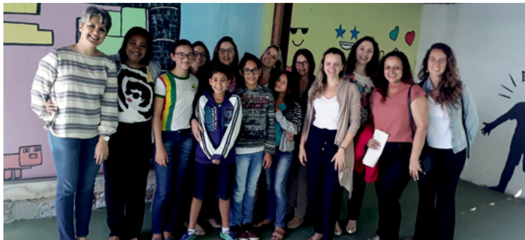
Secretaria de Educação e Esportes

Os visitantes participar de rodas de diálogo com estudantes e professores e conheceram os espaços educacionais