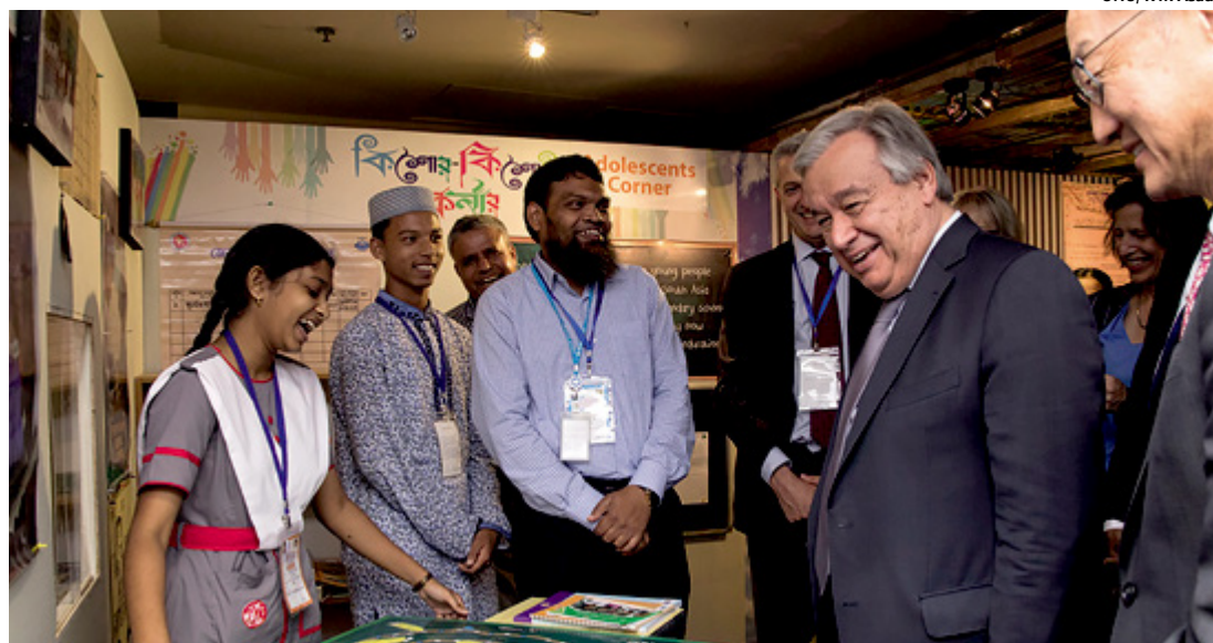
Antônio Guterres e o presidente do Grupo Banco Mundial, Jim Yong Kim, falam com crianças em uma exposição em Daca

■ A compaixão e a generosidade do povo de Bangladesh mostram o melhor da humanidade e salvaram milhares de vidas, segundo o secretário-geral Antônio Guterres.