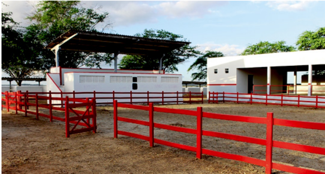
O Parque Professor Renato Moraes recebeu melhorias para a 46ª Expocose