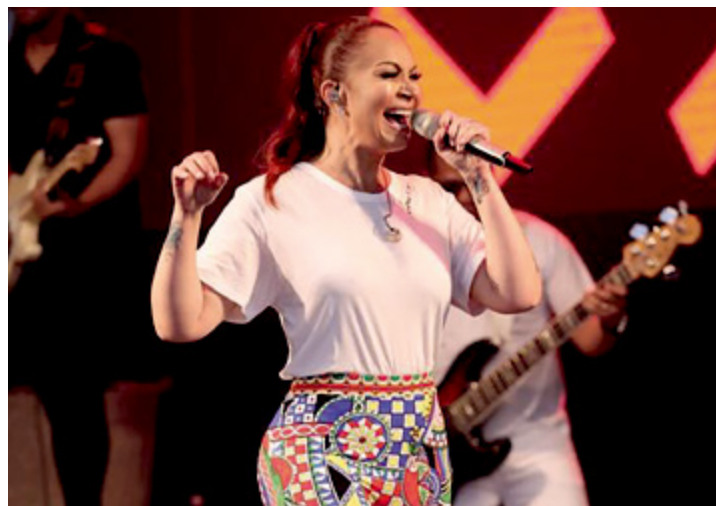
A cantora Solange Almeida é uma das atrações da programação cultural da exposição