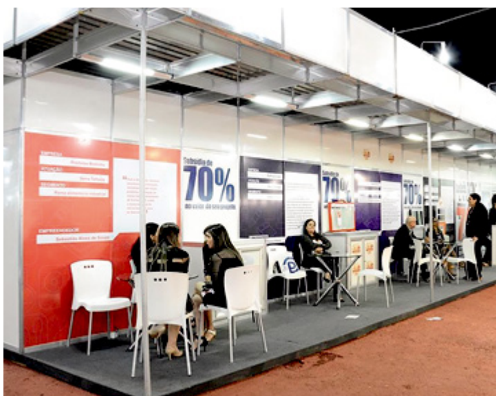
São esperadas pela organização cerca de 50 mil pessoas