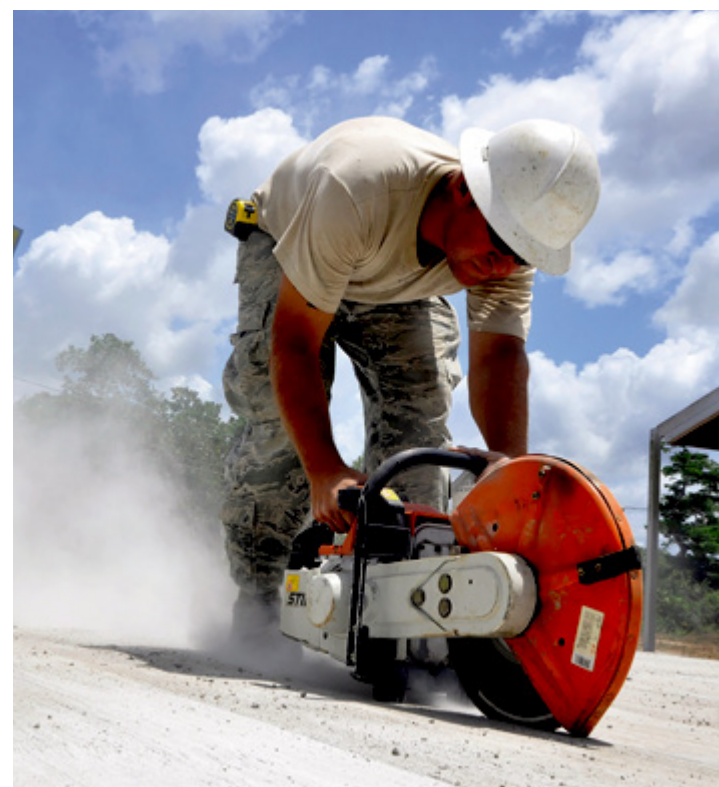
Implantação da PEC vai gerar milhares de empregos na região

O trabalho informal aponta outro fator a ser considerado, além da perda da qualidade dos postos de trabalho e da qualidade de vida do cidadão. A má remuneração nessas situações também pesa no sustendo da família do trabalhador brasileiro. E ao analisar pontos distantes da Região Metropolitana das capitais, as dificuldades são mais acentuadas pois contam com fatores climáticos e oferta, como no Semiárido nordestino. JS