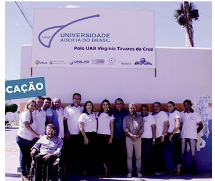
O polo UAB Cedro ofertará 1 curso de graduação e 7 cursos de pós-graduação

No dia 21 de julho foi realizada uma visita técnica por representantes do Mi-