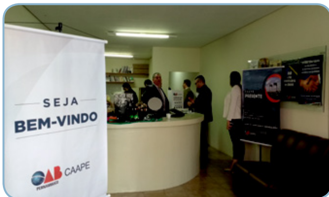
Serviços e benefícios levados aos advogados do interior pelo programa CAAPE Presente