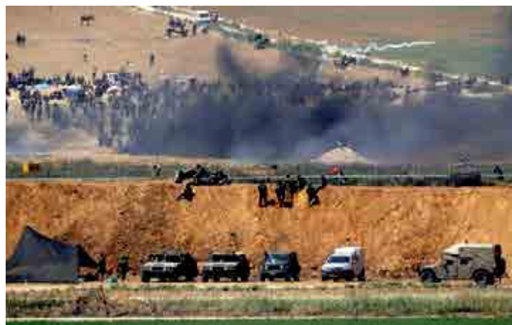
Registro de soldados na fronteira entre Israel e Gaza em abril deste ano

De acordo com Mladenov afirmou é de suma importância a implementação imediata de projetos de paz passados, com o objetivo de recuperar esforços para responsabilizar os governos, manter os termos do cessar-fogo de 2014 e parar a escalada militar. Ele destaca que a ONU deve aumentar a presença para melhorar a coordenação entre Israel, Egito e Autoridade Palestiniana. JS