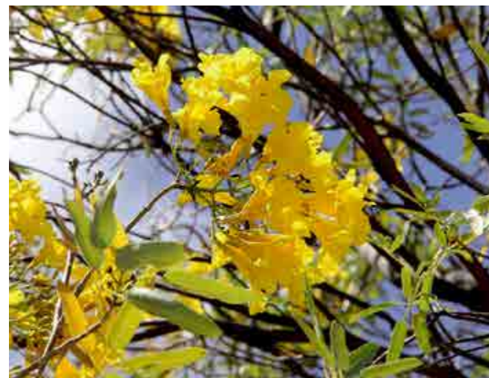
O ipê demora muitos anos para atingir a maturidade