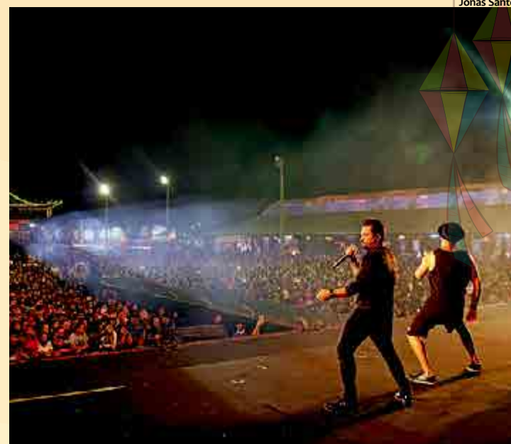
No Pátio Ana das Carrancas passam grandes nomes da música brasileira