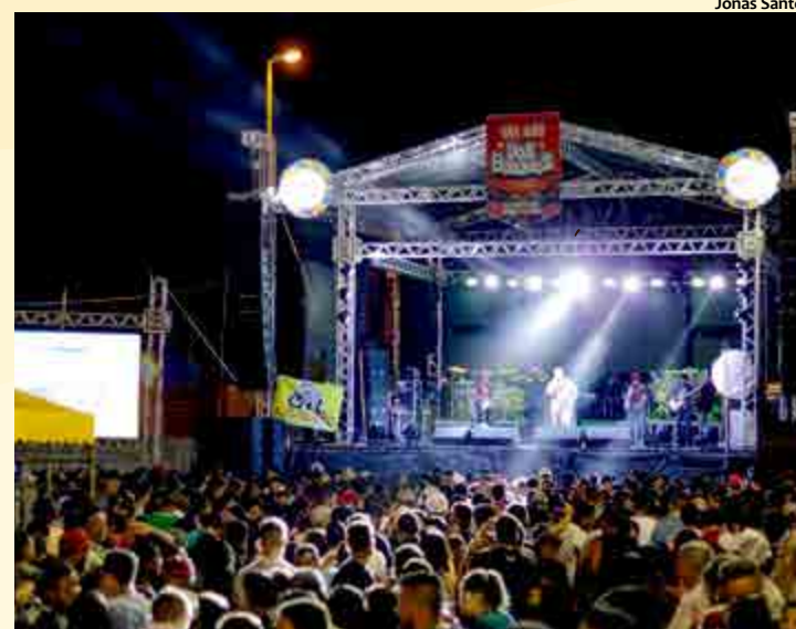
A prefeitura promove o arrasta-pé também nos bairros do município