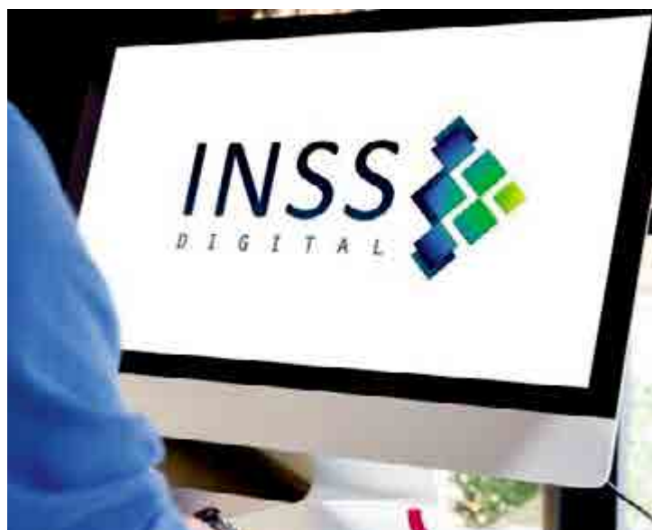
INSS Digital proporciona mais agilidade no atendimento ao público

Ao analisar Pernambuco, a evolução é ainda maior. O estado conta atualmente com