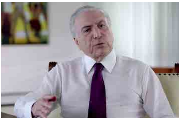
Com o aumento o valor passa de R$ 177,71 para R$ 187,79

■ O presidente Michel Temer anunciou em rede nacional um reajuste no Bolsa Família no último dia 30. Segundo o Ministério do Desenvolvimento Social o benefício terá um aumento de 5,67% a partir de julho. O pagamento passa a ser de R$ 177,71 para aproximadamente R$187,79. O presidente do país também fez uma reflexão sobre o Dia do Trabalhador celebrado em 1º de maio, além do anúncio da renovação do programa Luz Para Todos que prevê beneficiar dois milhões de brasileiros.