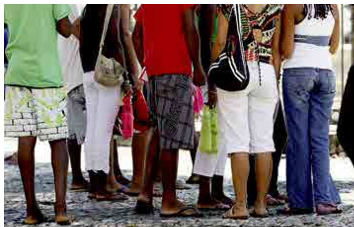
Pesquisa aponta que empregos informais representa 60% dos postos no mundo