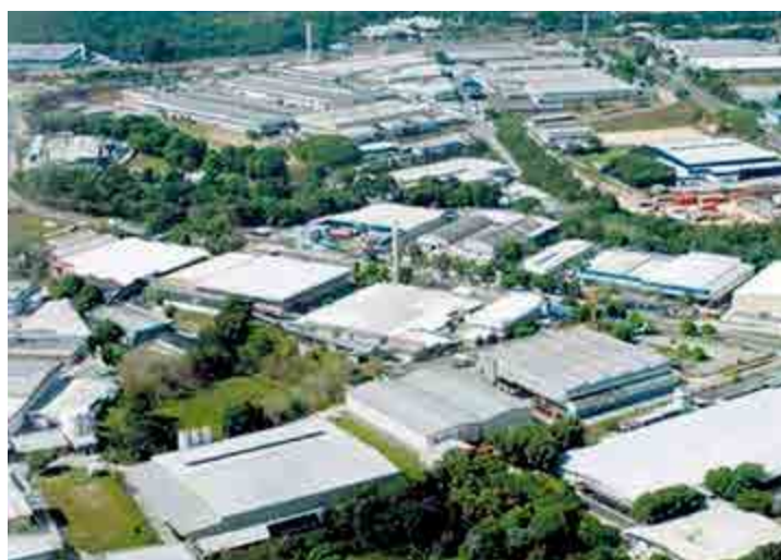
Registro aéreo do polo industrial da Zona Franca de Manaus