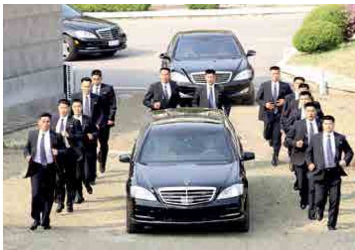
Escolta invulgar do presidente norte-coreano viralizou nas redes

Uma escolta invulgar chamou a atenção de pessoas ao