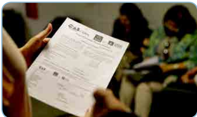
Muitos advogados do Estado já aderiram ao CAAPE+Seguro