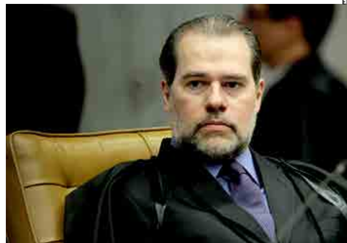
Toffoli argumentou no despacho que não vislumbra a ofensa apontada

menta que o caso não está relacionado com o esquema de corrupção da Petrobras investigado pela Operação Lava Jato e esse seria o motivo pelo qual o juiz não seria o natural para conduzir a ação penal.