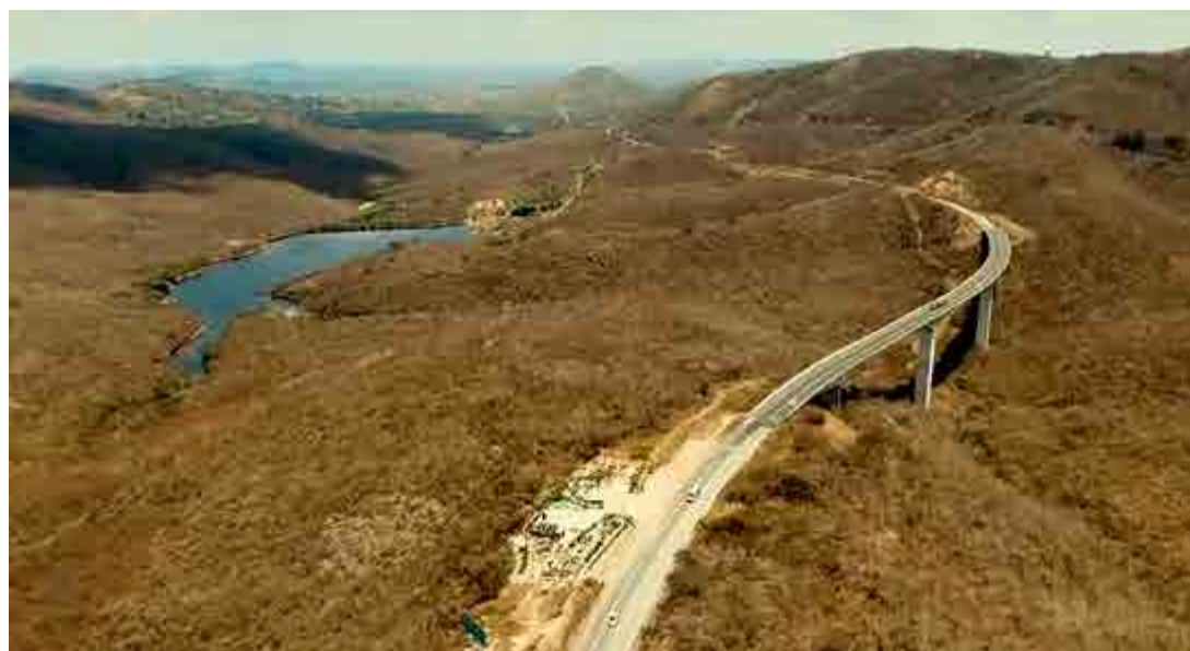
Mais de mil municípios serão beneficiados com a aprovação da PEC da Zona Franca do Semiárido Nordeste

AS - As empresas localizadas já nessa área, comércio, indústria, serviços e agropecuária, eles teriam o benefício se credenciando nos mesmos moldes das de novas empresas que virão para a região. Elas terão uma gama de documentação que farão com que elas se habilitem.