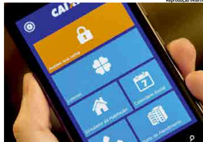
Muitos bancos do país realizam operações apenas em aplicativos