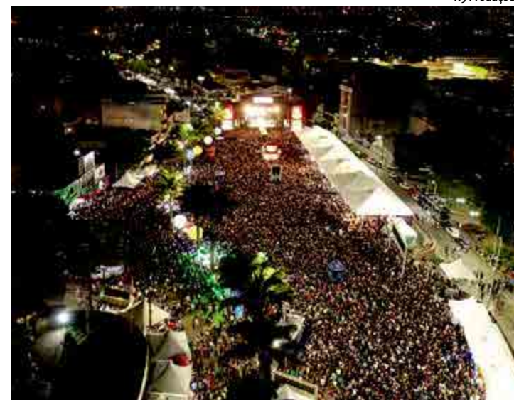
Durantes a festividade foram realizadas ações educativas

A Prefeitura de Garanhuns divulgou no último dia 27 o balanço da quinta edição do Viva Dominginhos, evento criado para homenagear a vida e a obra do instrumentista, cantor e compositor brasileiro José Domingos de Moraes, nascido em Garanhuns. De acordo com a prefeitura de 19 a 21 deste mês, cerca de 200 mil pessoas compareceram aos dois polos da festa.