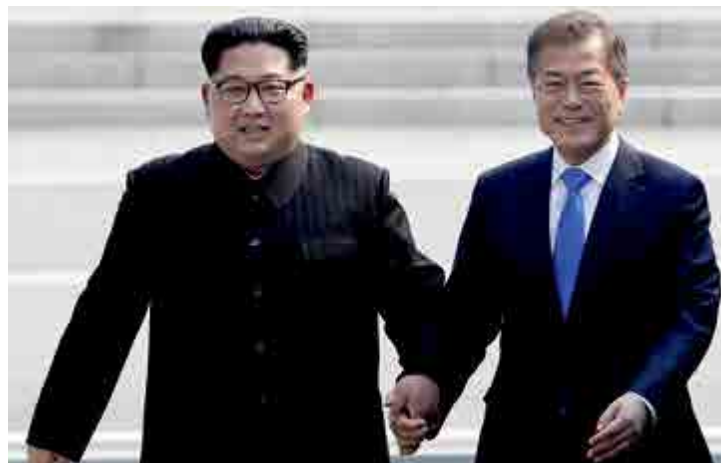
Em encontro realizado no dia 27 de abril eles apertaram a mão em momento histórico

O presidente norte-americano Donald Trump se pronunciou no Twitter sobre o encontro entre os líderes das duas nações. Ele atribuiu na rede social parte do mérito a si e a China. “FIM DA GUERRA DA COREIA! Estados Unidos e todo o seu GRANDE povo devem estar muito orgulhosos do que está acontecendo hoje na Coreia!”