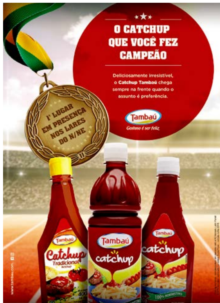
O Catchup Tambaú está entre os cinco preferidos em todo País