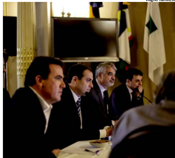
Paulo Câmara reuniu bancada federal para tratar de emendas parlamentares

segurança pública, Câmara frisou a importância de utilizar os recursos provenientes das emendas parlamentares para a conclusão do Complexo Prisional de Itaquitanga, pontuando que o investimento possibilitará uma importante mudança no sistema de ressocialização estadual. Ao todo, o complexo demandará R$ 80 milhões. Os R$ 60 milhões da reserva parlamentar serão utilizados para a con-