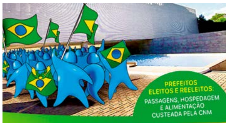
Os prefeitos embarcarão para Brasília em busca de atualizar as informações

■ Com o objetivo de buscar orientações e auxílio sobre a gestão, os novos prefeitos pernambucanos e os gestores reeleitos vão participar de um encontro promovido pela Confederação Nacional dos Municípios, em Brasília, entre os dias 09 e 11 de novembro. O Seminário Novos Gestores tem a expectativa de