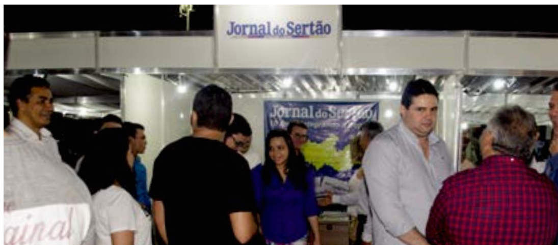
Exposerra movimentou R$ 20 milhões na economia do Sertão e atraiu público de 45 mil pessoas

De acordo com a organização, público que circulou, nos três dias de evento, foi de 45 mil pessoas e feira movimentou cerca de R$ 20 milhões