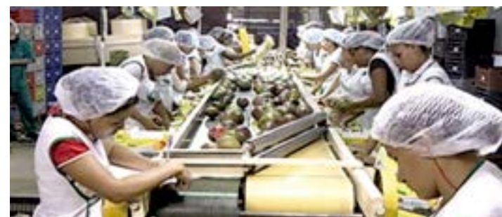
Ao final do estudo, será possível identificar gargalos do setor

O Ministério da Agricultura do Japão atualizou a norma que possibilitará ao Brasil exportar melão, caqui, frutas cítricas e novas variedades de manga para aquele país. O Vale do São Francisco, no Sertão do Estado, já exporta manga, mas a quantidade de variedades ainda é restrita. A previsão é que o mercado se potencialize em novembro deste ano, quando a norma entra em vigor e as garantias fitossanitárias estarão acordadas entre produtores brasileiros e o país asiático. De acordo com a Valexport, a exportação de manga no Vale apresentou um aumento de 20%, em 2015, em relação à safra anterior, registrando um acréscimo de mais US$ 21 milhões na pauta de exportações do País. JS