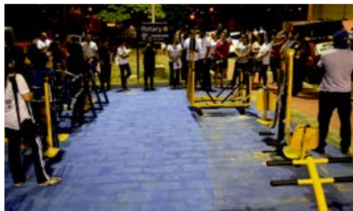
Comunidade da Avenida Antonio de Barros Muniz é a principal beneficiada

■ O Rotary Club de Araripina entregou para a cidade um espaço público para a prática de atividades físicas, dotado de seis equipamentos, que estão à disposição da comunidade, na Avenida Antonio de Barros