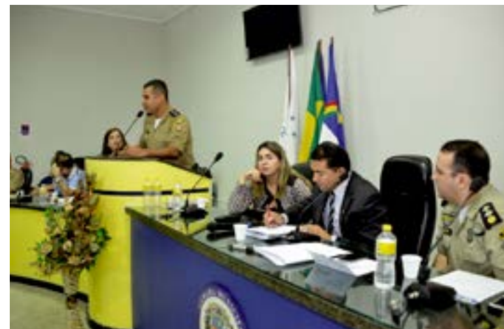
Autoridades e sociedade civil de Araripina pontuaram as necessidades locais para melhoria na segurança pública

Como resultado do debate, foi formulado um documento que será entregue ao Governo do Estado reivindicando cinco itens: instalação de uma Companhia Independente de Polícia Militar, aumento do efetivo da corporação, instalação do Instituto Tavares Buril,