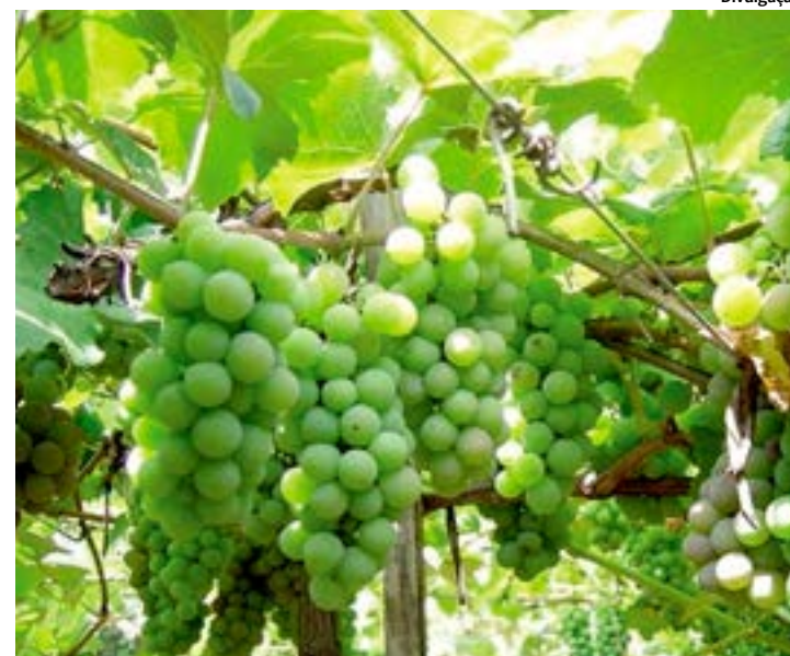
Malhada Real produz 100 toneladas de uva de mesa por ano