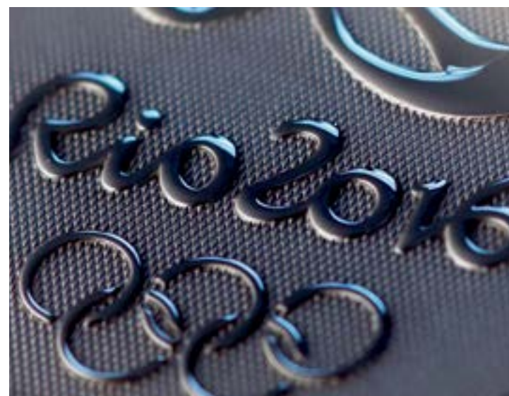
Alerta de segurança aumentou após a morte de 84 pessoas, em Nice, na França

Segundo Etchegoyen, os ministros da área de segurança e defesa estão revisando todo o dispositivo de segurança para identificar eventuais lacunas. Identificadas as lacunas, haverá incremento de algumas medidas, como mais