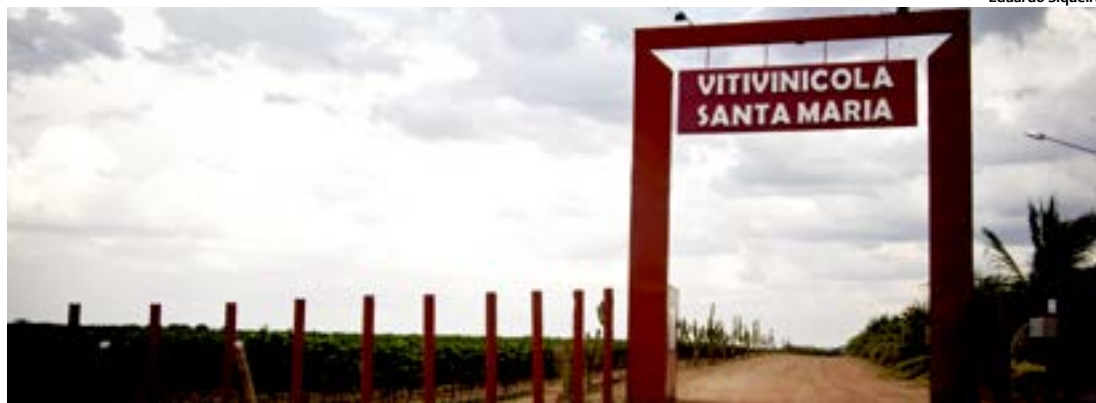
Vinícola está localizada em Lagoa Grande, Sertão de Pernambuco, e pertence ao grupo português Global Wines