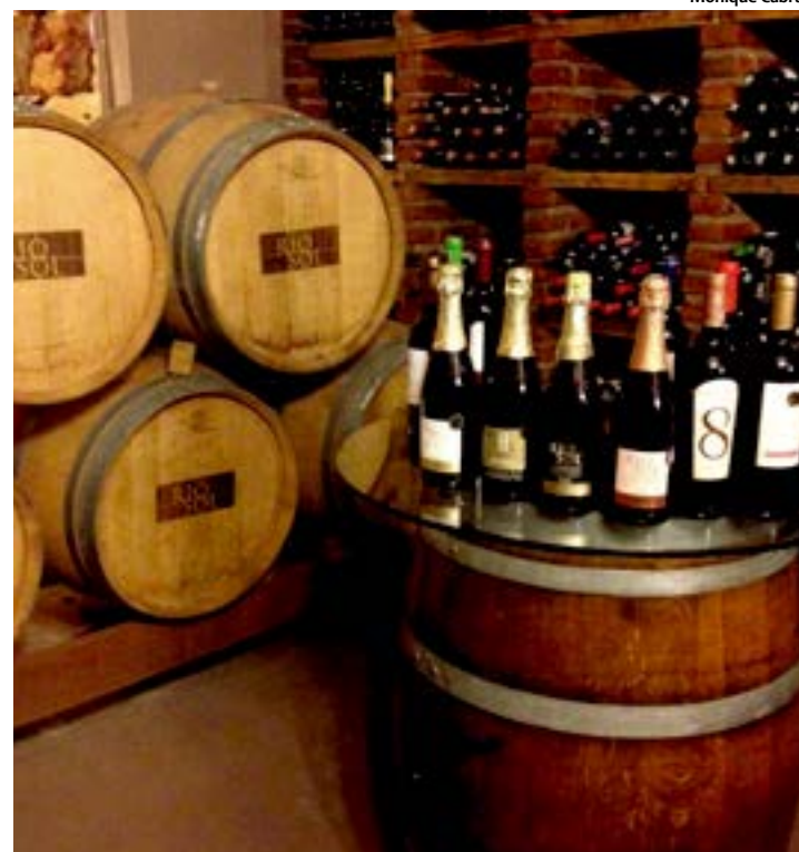
Rótulos da Rio Sol já receberam prêmios em Londres e Bruxelas