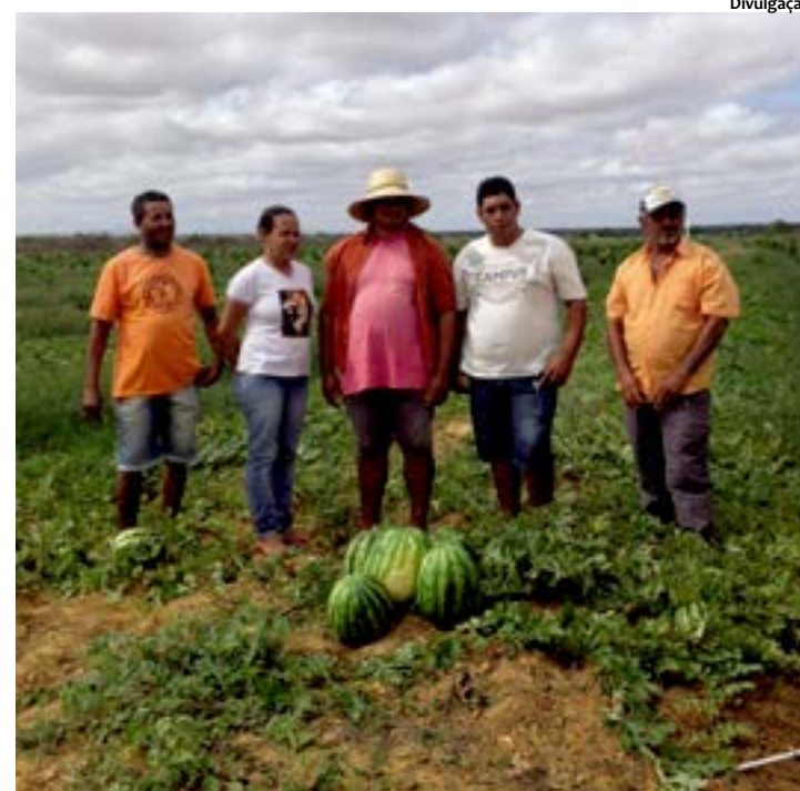
Quando as produções de manga e goiaba alcançarem retorno de investimento, a receita líquida da Associação chegará a R$ 1 milhão