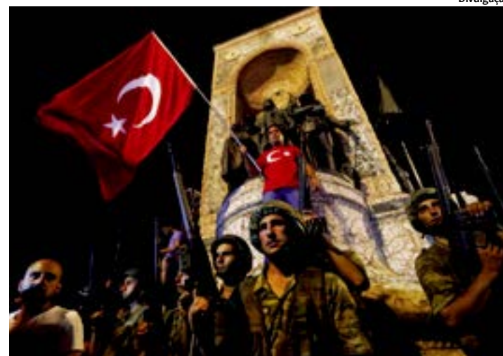
Tentativa de golpe por parte dos militares, resultou em morte de 265 pessoas

dar, 161 pessoas mortas fazem parte da multidão de civis e policiais contrários ao golpe, que foram às ruas defender a permanência do presidente turco Tayyip Erdogan.