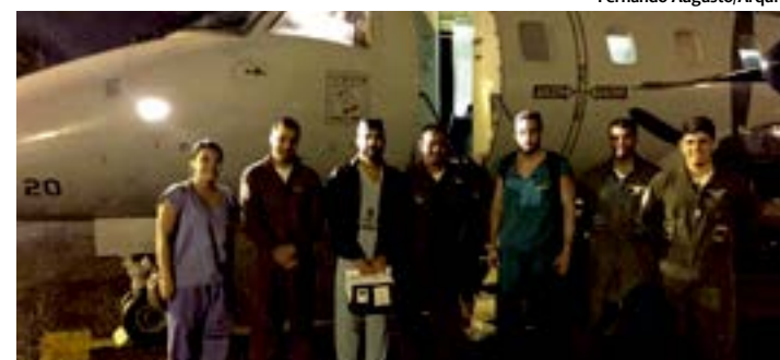
Órgão chegou ao Recife na madrugada do último dia 22