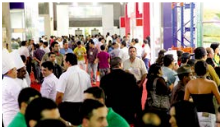
Feira tem exposição de produtos de diversos segmentos

Neste ano, a Aspa preparou uma programação de palestras com consultores