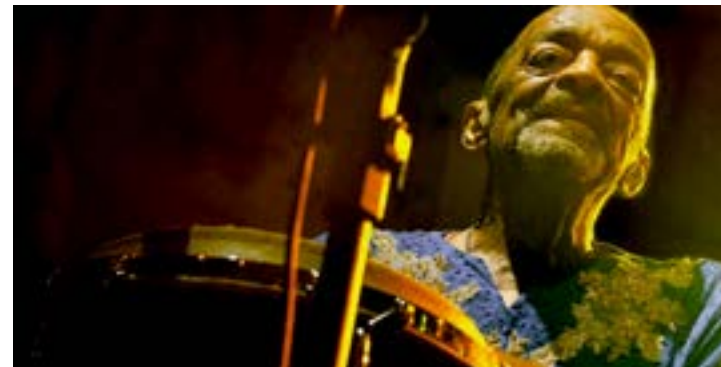
Eleito oito vezes o melhor percussionista do mundo, Naná Vasconcelos morreu aos 71 anos, no último mês de março

De acordo com Marcelino Granja, secretário estadual de Cultura, a dedicação de Naná às artes e seu empenho em levar, ao mundo, a força da cultura pernambucana inspiram este momento de construção do FIG. “Qualidades que, certamente, estarão refletidas em uma programação diversa, plural, que vai ampliar diálo-