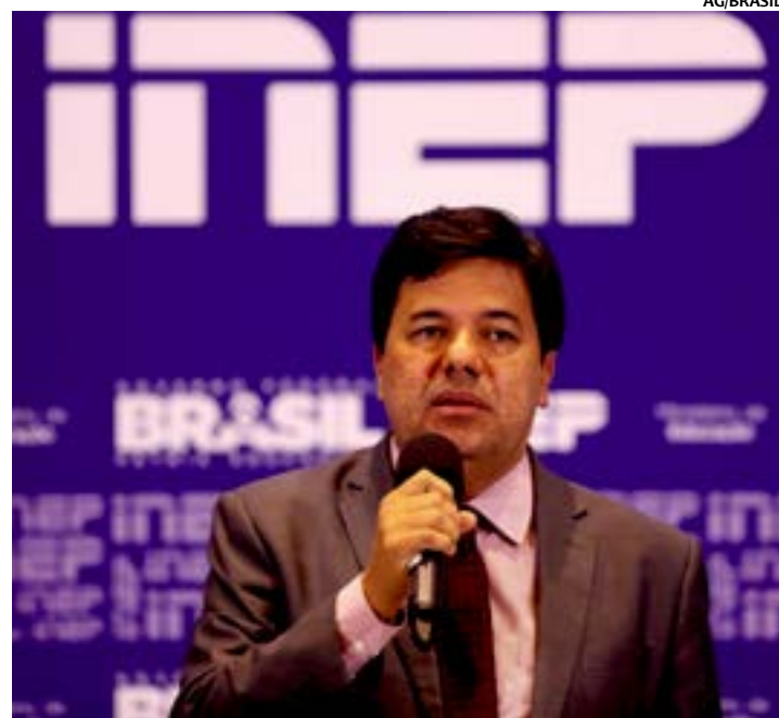
Liberação de recursos e novas vagas para o Fies

Outros R$ 80 milhões ajudarão, por meio de programas de parcerias com estados e municípios,