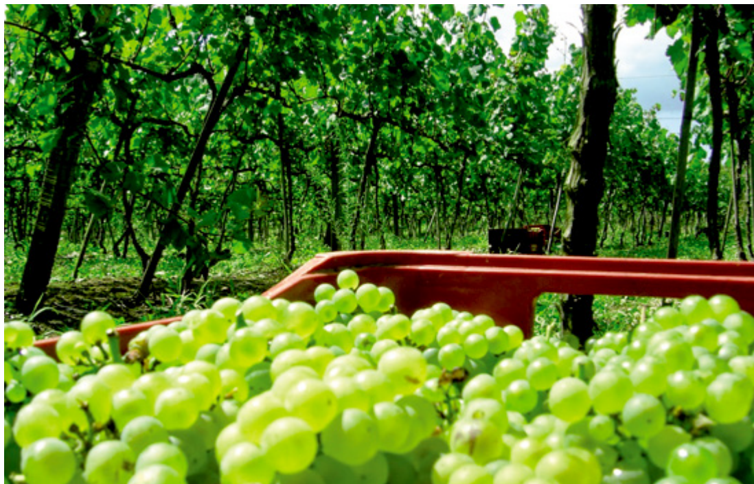
A cidade faturou US$ 86,5 milhões em exportações, de janeiro a setembro, e é segundo lugar no ranking do Estado

Mirella Araújo redacao@jornaldosertao.com.br