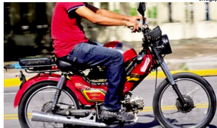
Mesmo com a suspensão da obrigatoriedade da CNH, condutores de cinquentinhas devem regularizar o veículo até o dia 11 de novembro

A medida teve como base a ação civil impetrada pela Associação Nacional dos Usuários de Ciclomotores (Anuc), justificando que o documento regularizado pelo Código de Trânsito Brasileiro (CTB), a Autorização para a Condução de Ciclomotores (ACC), não é oferecida por órgãos de trânsito e centros de formação de condutores, sendo considerada