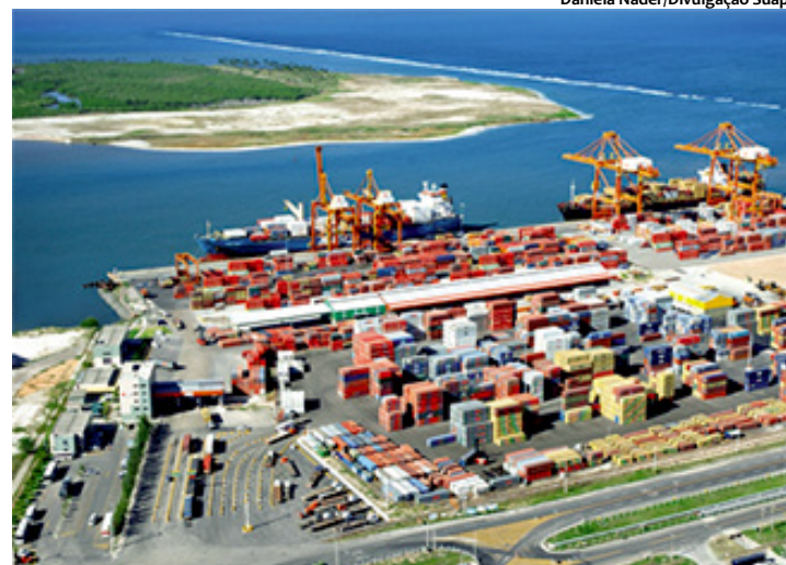
Estado discute entraves do custo operacional das exportações por Suape