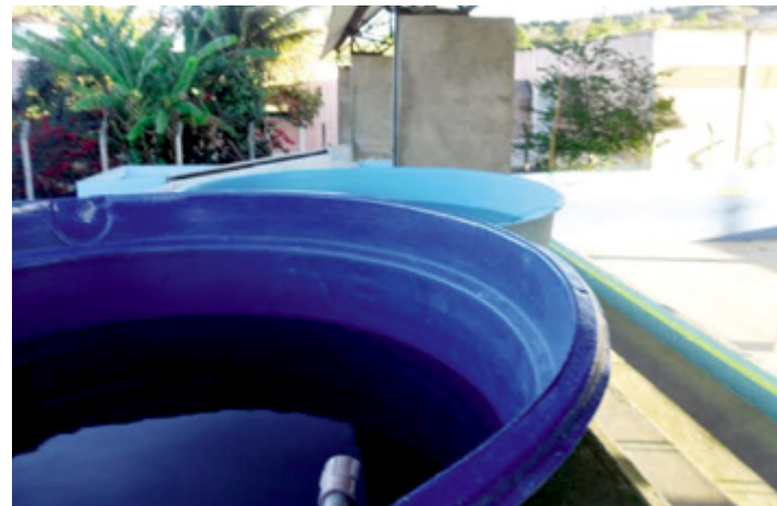
A expectativa era de que a transmissão da dengue tivesse uma diminuição nos períodos de maio, junho e julho quando as temperaturas estão mais baixas

Cidades como Camaragibe, Jaboatão dos Guararapes, Goiana, Jataúba e Inajá estão com a chamada infestação vetorial. Em outras palavras, o número de mosquitos transmissores da den-