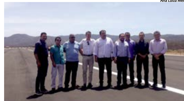
Representantes da sociedade civil e políticos também estiveram presentes