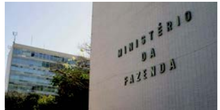
Ministério da Fazenda ordenou pagamento no dia 29 de dezembro

considerado o último dia útil do ano para realização de operações financeiras, haveria risco de que esses recursos só entrassem nas contas das prefeituras em janeiro. O Ministério da Fazenda descartou essa possibilidade. Para evitar atrasos, houve a integração do dinheiro da repatriação e a terceira parcela mensal de repasses do Fundo de Participação dos Municípios (FPM). Ainda no dia 29, o governo também depositou o valor devido aos municípios pelo Fundo de Manutenção e Desenvolvimento da Educação Básica e de Valorização dos Profissionais da Educação (Fundeb). Esse pagamento somou R$ 1,053 bilhão. Ao todo, considerando o dinheiro da multa da repatriação e do Fundeb, os municípios receberam R$ 5,502 bilhões. JS