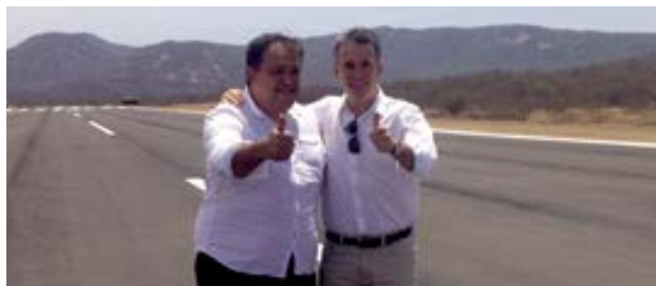
Secretários de Estado apresentaram projeto do novo aeroporto

"Esse é o resultado da decisão política do governador Paulo Câmara e do prestígio para obter recurso junto ao Ministério dos Transportes, comandando por Maurício Quintella, em um momento de crise econômica. A iniciativa vai fortalecer a integração nacional por meio dos voos regionais", afirmou. Além de fomentar o desenvolvimento, a iniciativa também vai economizar o tempo dos pajeuzeiros. A viagem entre o município e a capital costuma durar cinco horas. De avião, o trajeto vai levar apenas uma hora. JS