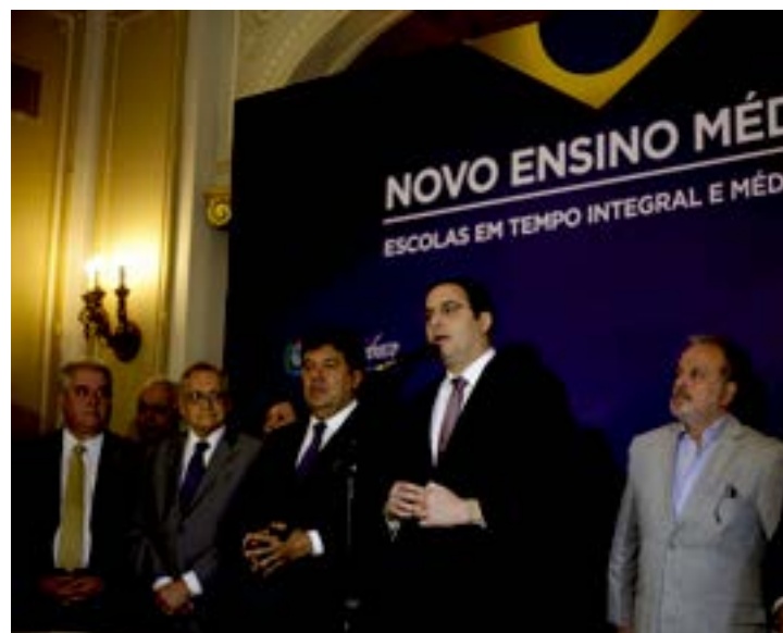
Paulo Câmara e Mendonça Filho anunciaram investimentos

Apoiadas pelo Fundo Nacional de Desenvolvimento da Educação (FNDE), as 36 escolas estão localizadas em 27 municípios. Estão contem-