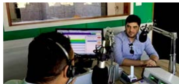
O deputado federal concedeu entrevista em rádio local