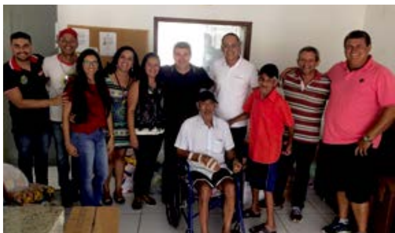
A rádio Petrolina FM realizou a 'Campanha Natal com Amor da Petrolina FM', com doações de alimentos não perecíveis, brinquedos, fraldas geriátricas, a duas instituições beneficiadas, foram elas: Casa Semente do Amanhã (crianças) e Cantinho do Aconchego (idosos), ambas instituições de Petrolina/PE.