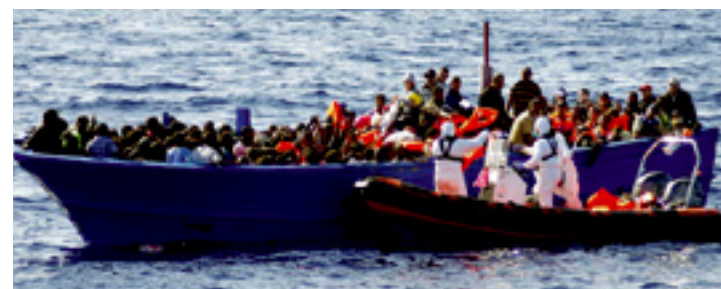
As ilhas gregas, no Mar Egeu, têm sido a região mais afetada pelo fluxo migratório

■ A agência europeia de gestão de fronteiras, Frontex, anunciou, no último dia 13 de outubro, que mais de 710 mil imigrantes entraram na União Europeia nos primeiros nove meses deste ano. No ano passado, o total foi de 282 mil. A agência informou que as ilhas gregas, no Mar Egeu, especialmente Lesbos, continuam sendo as mais afetadas pelo fluxo obrigatório, recebendo cerca de 350 mil imigrantes entre janeiro e setembro. A Síria