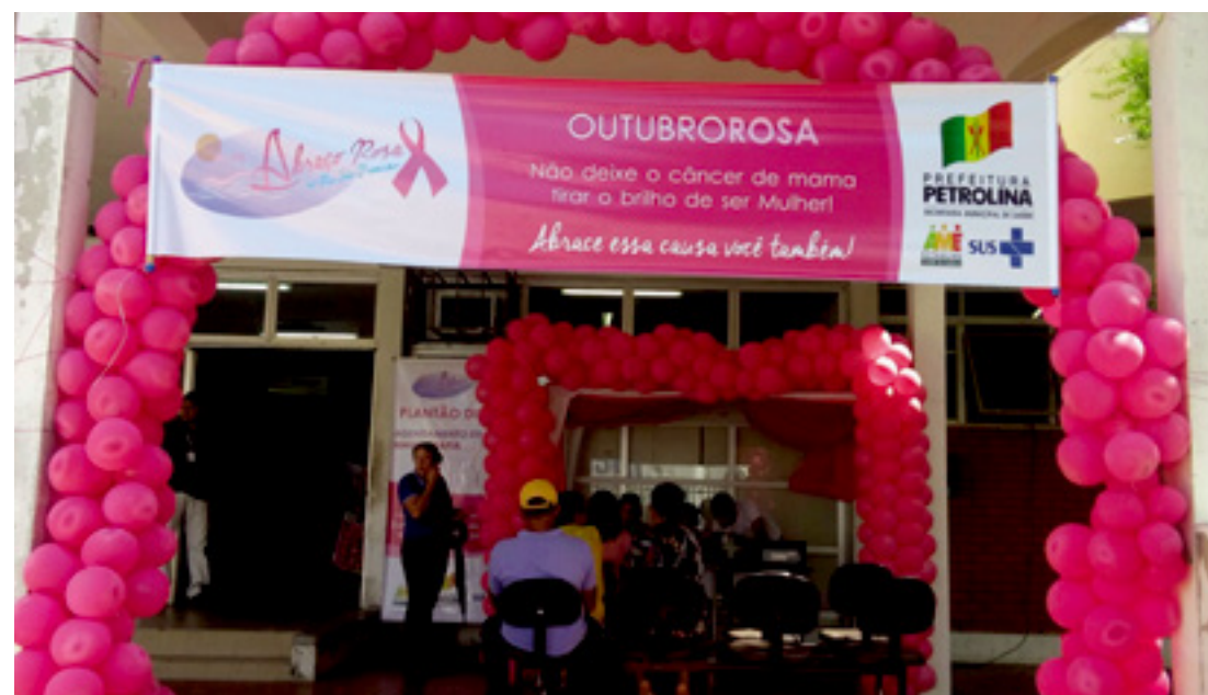
Nos Mutirões de Mama as mulheres atendidas podem realizar o exame clínico e o citopatológico (preventivo)