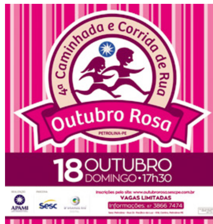
Os kits da corrida devem ser retirados de 14 a 17 de outubro no Hospital Dom Tomás, no bairro Gercino Coelho.