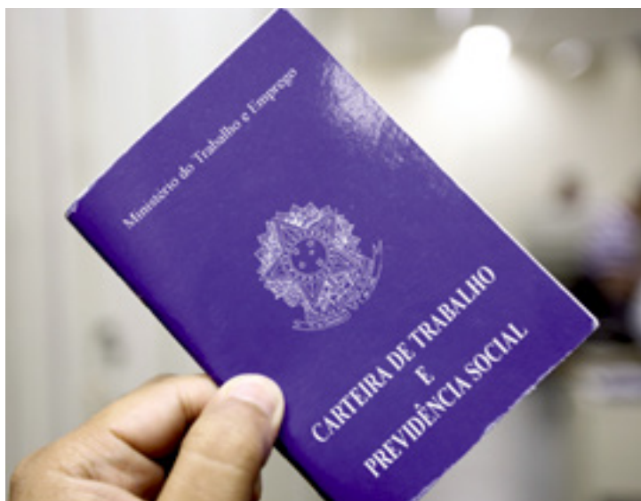
A partir de outubro, os empregadores devem pagar, obrigatoriamente, o FGTS aos empregados domésticos

que antes era opcional, ele deverá preencher a data em que começou a realizar o recolhimento para aquele empregado. (G1) JS