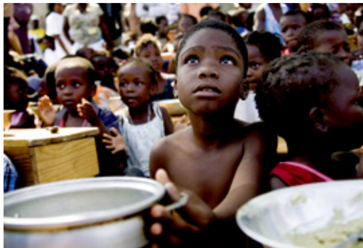
Há ainda 52 países que continuam com níveis de fome entre o sério e o alarmante

■ O Instituto Internacional de Investigação sobre Políticas Alimentares (IFPRI), responsável pela elaboração do Índice Global sobre Fome (IGF) 2015, revelou que, nos últimos 15 anos, houve avanços significativos na luta contra a fome, o que representa uma redução de 27%. Entre os nove integrantes da Comunidade dos Países de Língua Portuguesa (CPLP), cinco foram avaliados: Angola, Brasil, Guiné-Bissau, Moçambique e Timor-Leste. O Brasil reduziu em cerca de 66% os casos de fome, entre 2000 e 2015, e já se encontra entre os países mais próximos de erradicar a fome, com pontuação inferior a 5 no IGF. Os países que estão perto de acabar com a fome ficam