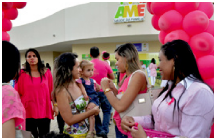
O diagnóstico precoce do câncer de mama aumenta em até 90% as chances de cura

Estarão disponíveis o exame clínico e o citopatológico (preventivo), além de sessões de relaxamento e ginástica laboral com os profissionais do Núcleo de Apoio à Saúde da Família