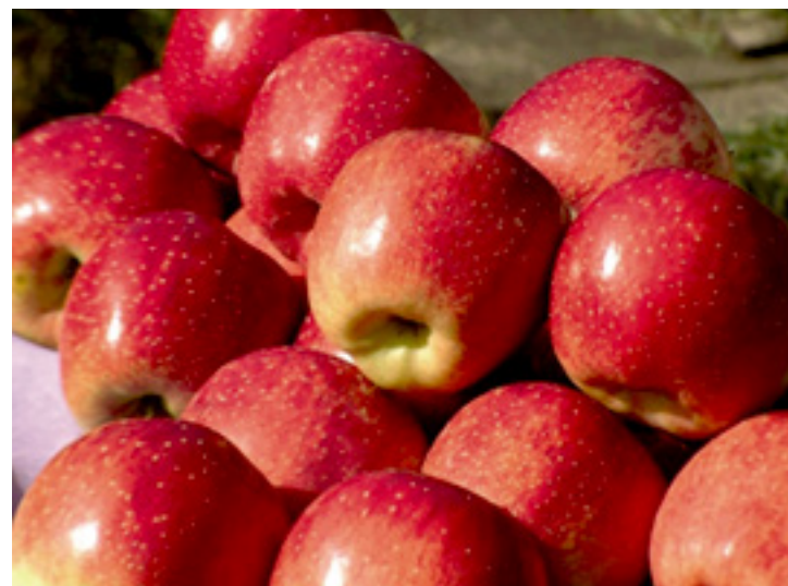
A maçã chinesa poderá entrar no Brasileira com preço menor que o da fruta nacional