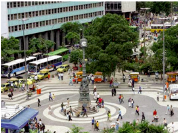
O Rio de Janeiro foi o segundo estado em número absoluto de mortes intencionais - 5.714 em 2014 e 5.348 em 2013

No Nordeste, o estado de Alagoas teve a maior taxa de mortes intencionais por 100 mil habitantes: foram 66,5 no ano passado. Mas o número representa uma queda de 3,5%, se comparado à taxa de 2013, quando o estado teve 68,9 mortes por grupo de 100 mil pessoas. Já a Bahia, regis-