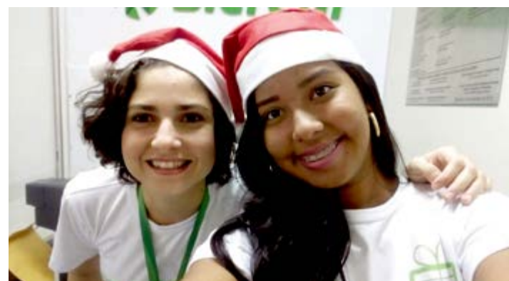
Cooperados e colaboradores se engajaram na campanha