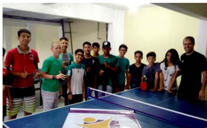
Entidade promove ações de promoção a saúde e a qualidade de vida

O Instituto Irene Cordeiro, com sede em Arcoverde (PE), tem entre outros objetivos, a realização de projetos sociais que promovam a saúde e a qua-