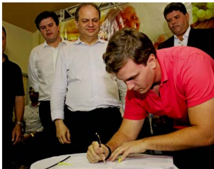
O anúncio foi feito pelo Ministro da Saúde, Ricardo Barros, no dia 7 deste mês

Segundo o ministro Ricardo Barros, os recursos já estão à disposição da Prefeitura Municipal, devendo a primeira parcela ser liberada ainda este ano. "O prefeito terá liberdade para usar esses investimentos da