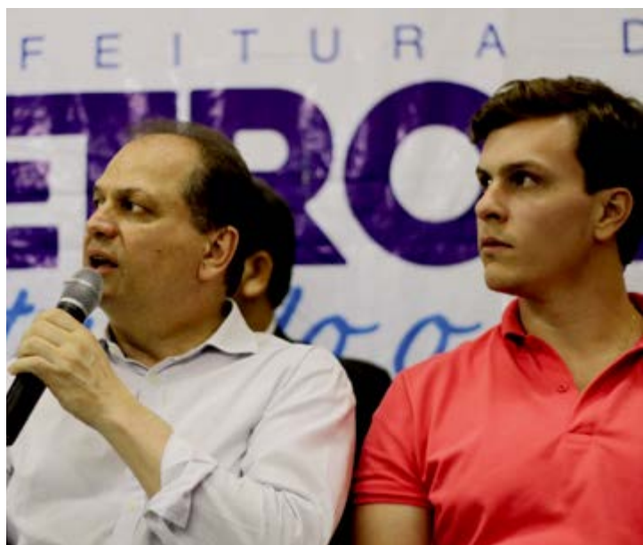
Segundo o ministro, os recursos já estão à disposição da Prefeitura Municipal

De acordo com a prefeitura, cerca de R$ 2 milhões serão investidos na construção de um laboratório público de exames e um centro de diagnósticos, além de 5 unidades básicas de saúde (UBS) a um custo previsto de quase R$ 3 milhões. Para garantir o custeio do setor, um total de R$ 5 milhões será empregado na manutenção de postos de saúde, pagamento de profissionais, compra de medicamentos e utensílios usados no atendimento médico diariamente. "Esses recursos garantem a realização de novas estruturas e irá melhorar o atendimento médico da cidade", afirmou Miguel Coelho, indicando ainda que parte dos recursos será investido na compra de 13 novas ambulâncias para renovar o equipamento do Samu e também na aquisição de 30 consultórios odontológicos. Segundo o prefeito, parte do valor liberado faz parte de emendas parlamentares do senador Fernando Bezerra Coelho e dos deputados Fernando Filho e Adalberto Cavalcanti. JS