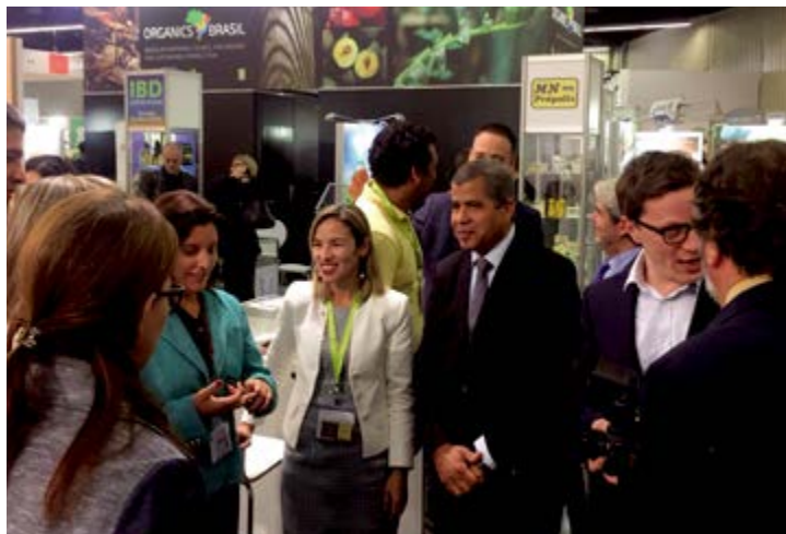
A Coodapis participa desde 2012 da maior feira de orgânicos do mundo, a Biofach

A Coodapis participa desde 2012 da maior feira de orgânicos do mundo, a Biofach, na Alemanha. No próximo ano, apresentará Pernambuco novamente e, desta vez, apresentará o Umbu como novidade. “Durante os eventos internacionais, sempre somos procurados por diversos clientes interessados em conhecer e comercializar nossos produtos. No início do ano, conseguimos contato com o cliente da Suécia na Biofach 2017. Ainda estamos em fase de negociação, ainda não é possível