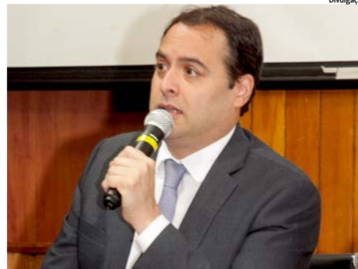
Câmara diz que Temer não respondeu carta de governadores

Segurança Hídrica - A preocupação com o Rio São Francisco, diante da seca que assola a região há mais de cinco anos, passa a contar com um novo aliado, com a definição de novas regras para operação dos reservatórios do Velho Chico, implementadas pela Agência Nacional de Águas (ANA), no dia 7 deste mês. A partir de agora, através da resolução nº