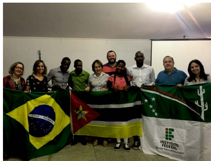
Moçambicanos passarão um mês no campus Petrolina Zona Rural

De acordo com a instituição, ao longo de um mês, os quatro professores terão acesso a práticas de manejo de solos, irrigação, drenagem, climatologia, extensão rural e cooperativismo, fitos sanidade e pós-colheita, além de agroindústria. “É com enorme expectativa que estamos