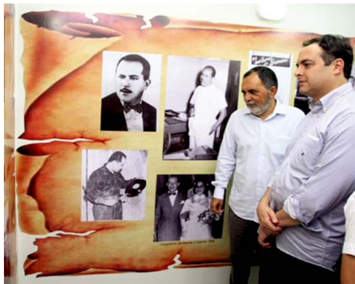
Zé Dantas é conhecido pelas músicas gravadas com o mestre Luiz Gonzaga

A Festa de Zé Dantas contou com oficinas de música, poesia e literatura de cordel, além de danças populares, violeiros, mesa de glosa, futebol e forronatas