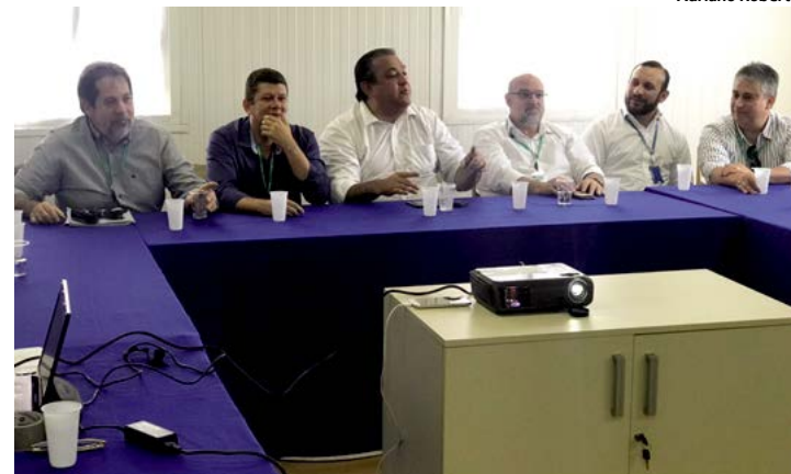
Em coletiva de imprensa, Veras declarou estar surpreso com avanço das obras