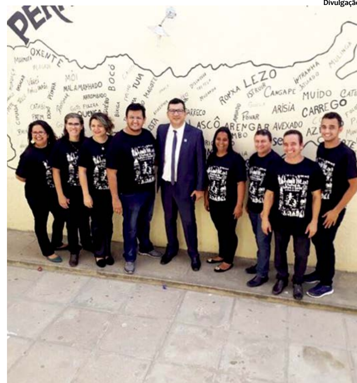
Projeto quer despertar o interesse em gêneros literários