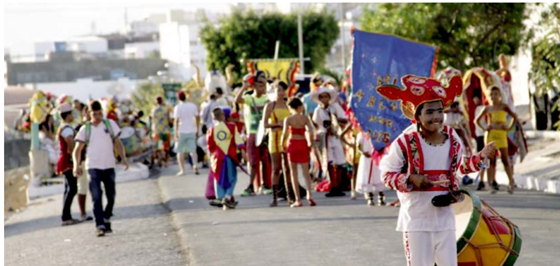
Liga Cultural de Bois e Similares de Arcoverde criou evento com objetivo de fortalecer as tradições

A tradição dos Bois e Ursos é uma das expressões mais ricas da cultura local, além do samba de coco. Esses ritmos característicos tomam conta da cidade em várias ocasiões do ano