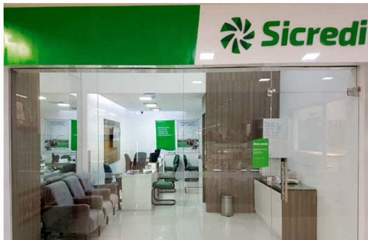
Agência localizada em Petrolina, no River Shopping, é mais nova aposta