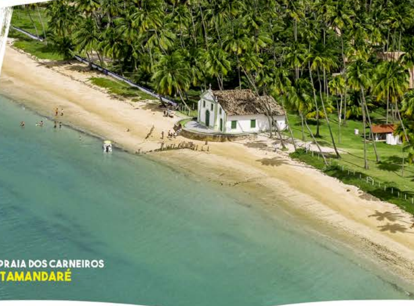
PRAIA DOS CARNEIROS TAMANDARÉ

f/descubrapernambuco @descubrapernambuco www.descubrapernambuco.com.br