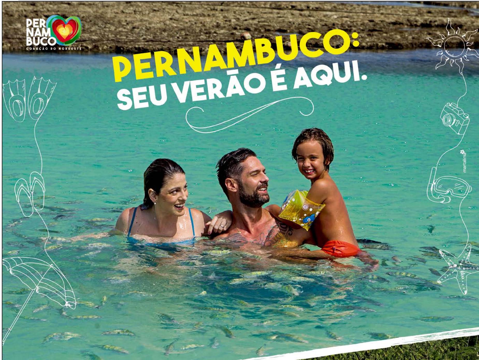
PORTO DE GALINHAS