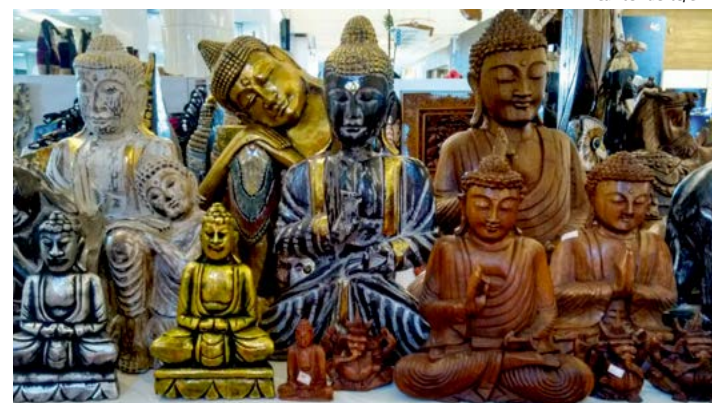
A Feincartes será realizada no Centro de Convenções Senador Nilo Coelho

de açúcar reduzido”, explica. Segundo Maria, o público será surpreendido com uma verdadeira viagem pela história e cultura de inúmeros povos. “Teremos dois estandes da Turquia, acessórios e produtos de decoração da África do Sul, Egito, Equador e Paquistão, além de peças étnicas, esculturas, pinturas e artigos de moda de lugares como Peru, Quênia, Nigéria e Senegal”, destaca. A 6ª edição da Feincartes será realizada no Centro de Convenções Senador Nilo Coelho, localizado na Avenida 31 de março s/nº, no Centro de Petrolina. O evento terá cursos, oficinas de artesanato e apresentações artísticas com talentos regionais. Mais informações estão disponíveis no site www.feincartes.com.br/petrolina . JS