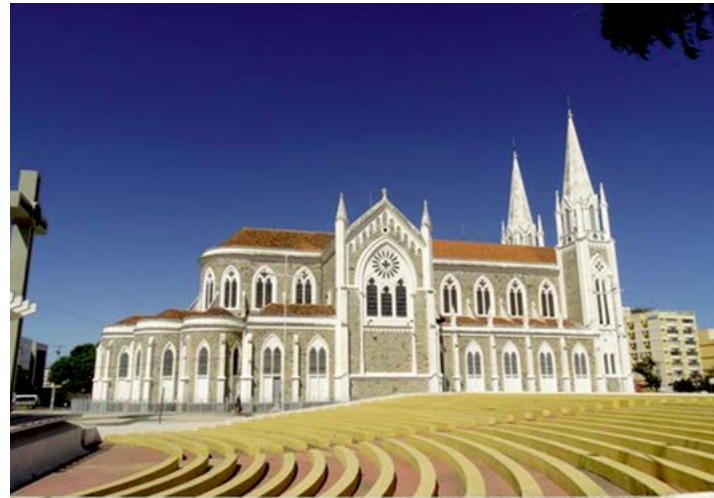
Comércio petrolinense promove programação diferenciada para atrair clientes

aos sábados, durante todo o mês de Dezembro, além disso, um grande sorteio com as premiações para quem participar da campanha será realizado na primeira quinzena de Janeiro. O evento será concentrado entre a Praça Dom Malan e a Concha Acústica, ao lado da Catedral de Petrolina, um dos principais pontos de visitação desta cidade sertaneja. “É um período, sem dúvida, de grande expectativa e movimentação para o comércio. Esperamos que essa nova formatação possa ser abraçada por todos e se torne um modelo referencial para anos posteriores. Sabe-se que o país vivencia um período complexo na economia, mas