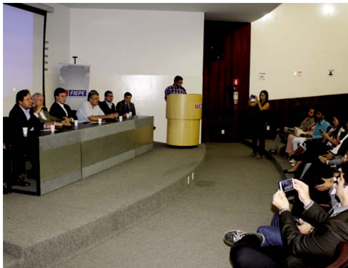
Presidente garante que crise é momento de aproveitar oportunidades