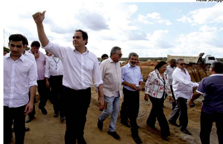
A adutora irá abastecer aproximadamente 400 mil pessoas de vários municípios