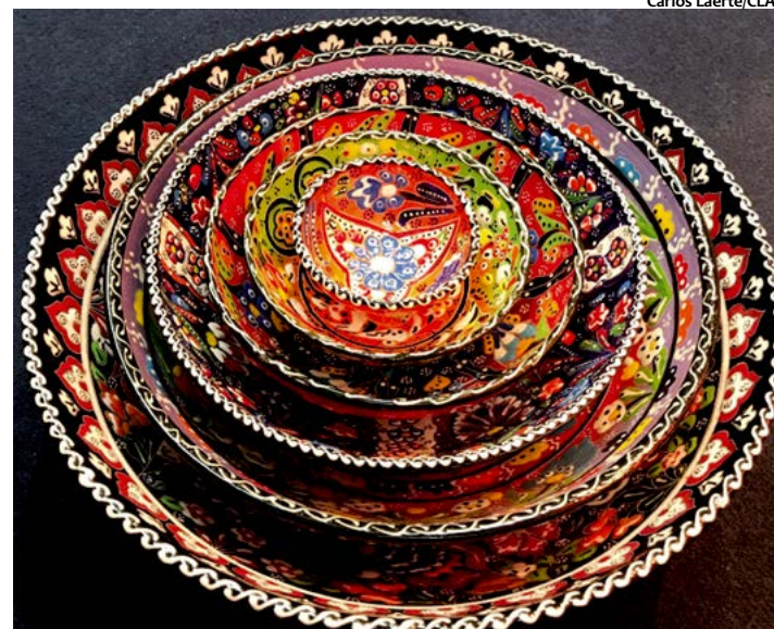
Evento conta com mais de 180 expositores de 11 países e de 12 estados brasileiros