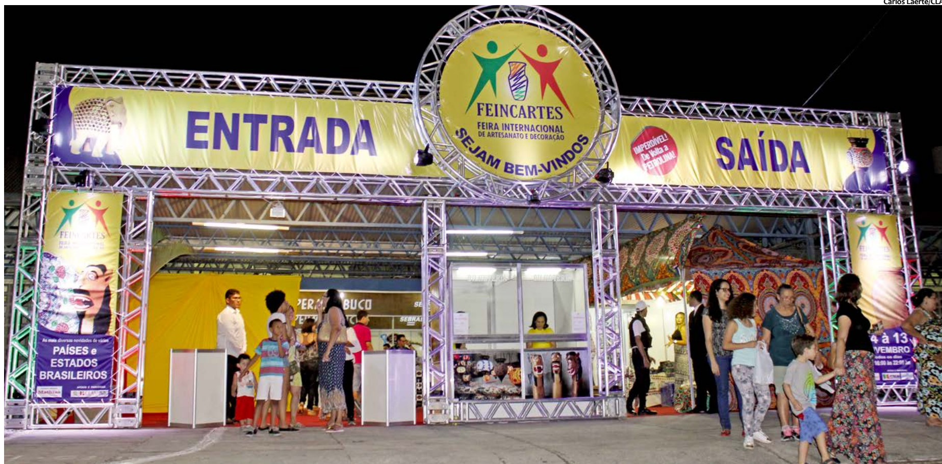
Feira conta com estandes da Turquia, África do Sul, Egito, Equador e Paquistão, além de peças étnicas, esculturas, pinturas e artigos de moda de lugares como Peru, Quênia, Nigéria e Senegal