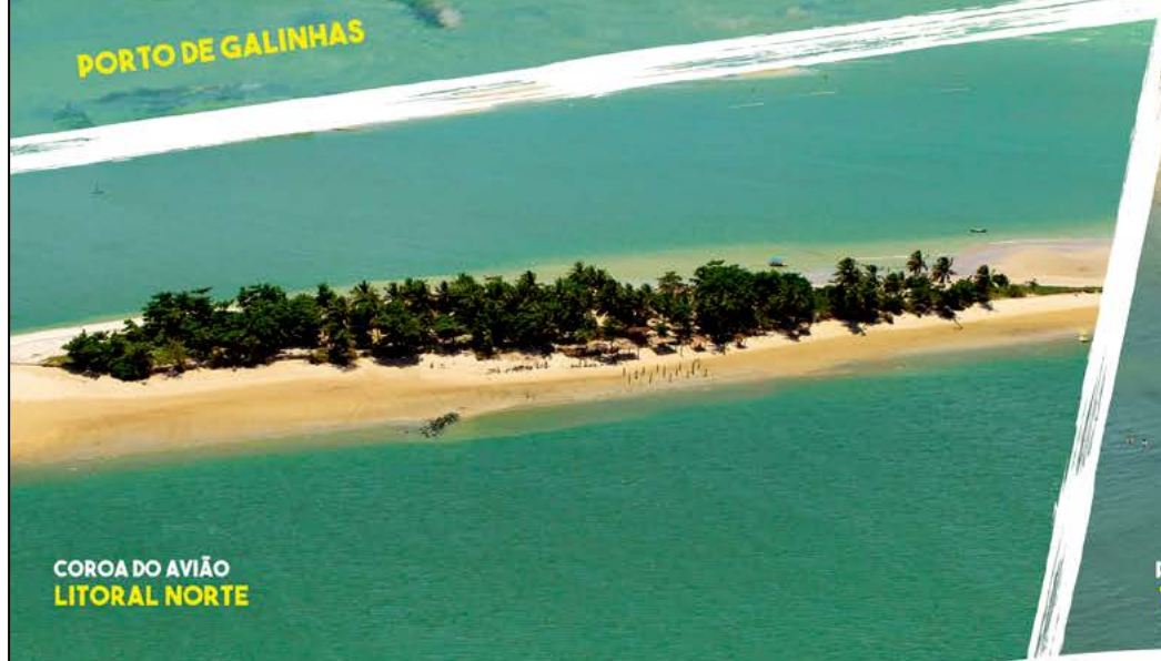
COROA DO AVIÃO LITORAL NORTE