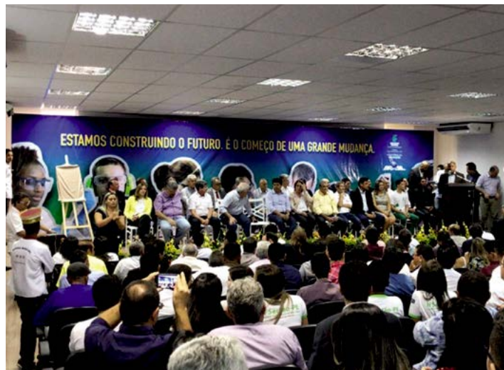
Com a inauguração, unidade poderá atender 1, 2 mil estudantes

De acordo com a reitora do IF Sertão-PE, Leopoldina Veras, a expansão da rede federal de educação técnica profissional era muito aguardado, além de citar que, até 2019, também será espaço de formação em nível superior. Segundo a reitora, o prédio foi construído com a capacidade de ofertar mais cur-