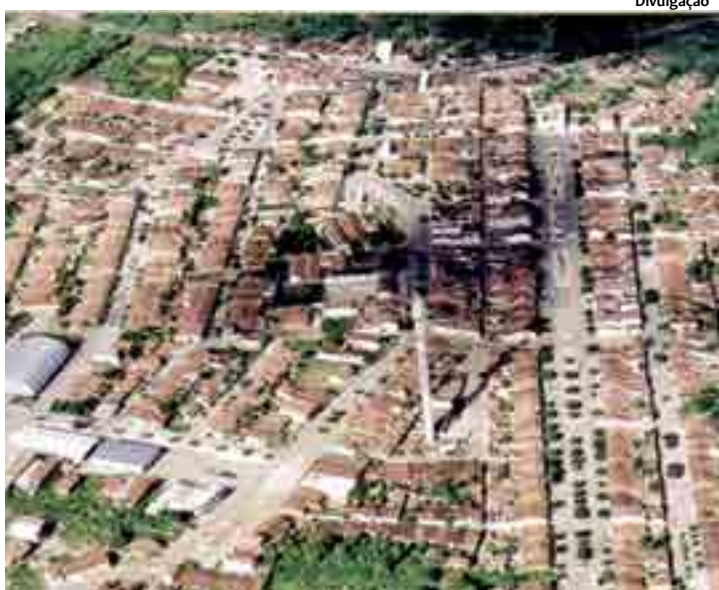
Município de Brejinho, no Sertão do Estado, distante 400 km da capital