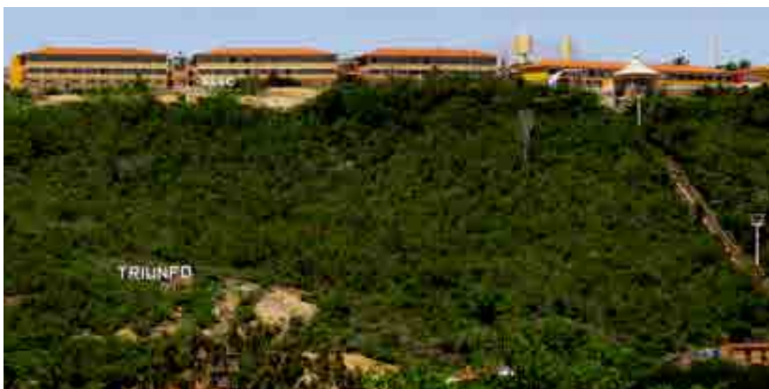
Localização geográfica confere à região temperaturas de 28°C no verão e 5°C no inverno