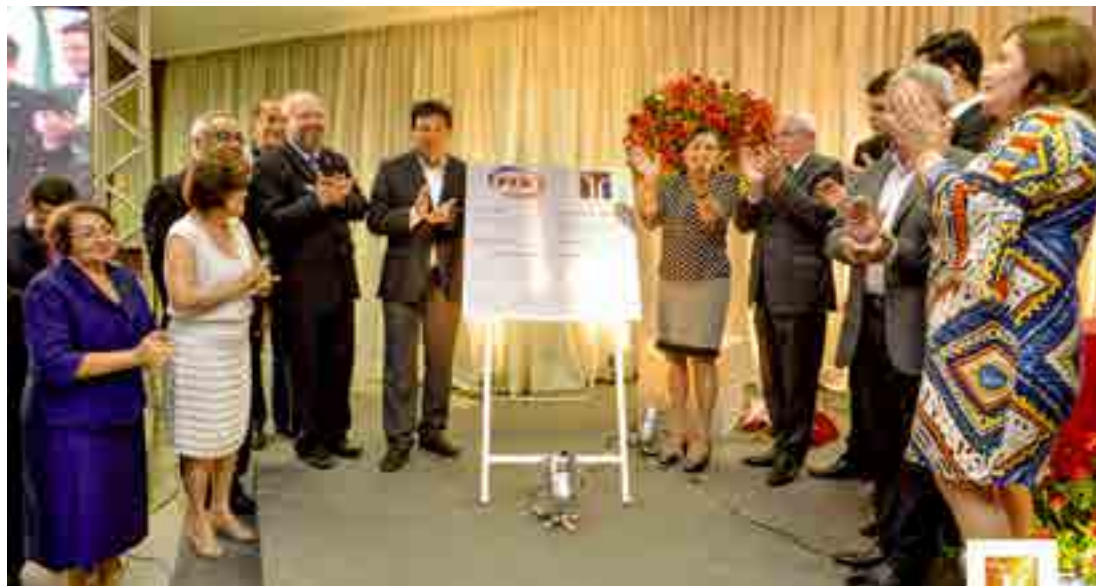
O Ministro da Educação, Mendonça Filho, prestigiou evento que contou com presença de diretores, alunos e professores

Ministro da Educação, Mendonça Filho participou da celebração de aniversário e destacou desempenho da instituição nas notas do MEC