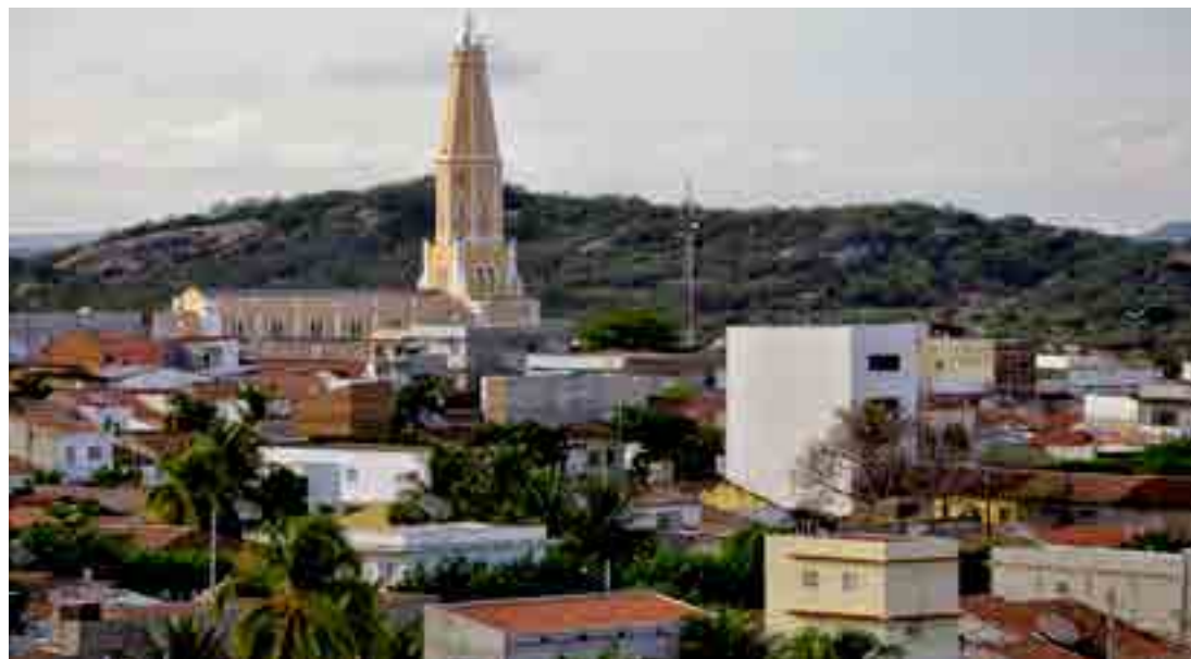
Itapetim está posicionada no 8º lugar do ranking, ao lado dos outros sete municípios sertanejos