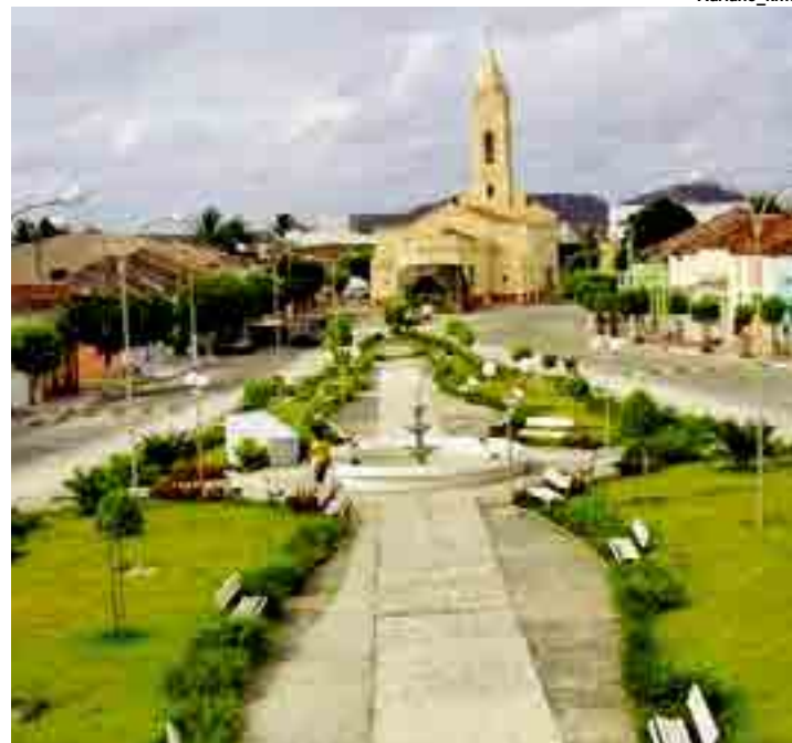
Carnaíba possui o 6º no "pódio"