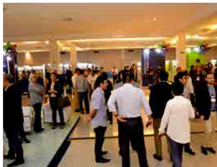
O encontro reuniu cerca de 50 estandes, distribuídos em um espaço de eventos

As diversas cadeias produtivas do Estado, que incluem os setores Metal Mecânico e Automotivo, Construção Civil, Alimentos e Bebidas, Químicos e Derivados e Gráfico e Embalagens, estiveram reunidos no I Encontro da Indústria de Pernambuco, realizado nos dias 6, 7 e 8 deste mês, no Shopping Riomar, no Recife. O evento, promovido pela FIEPE e pelo Sebrae, contou com a participação de fornecedores, distribuidores, compradores e industriais, os quais puderam expor os produtos para o público visitante, apresentar a diversidade das empresas pernambucanas e fechar novos negócios e parcerias. O encontro reuniu cerca de 50 estandes, distribuídos em um espaço de eventos do shopping e divididos em ilhas, se tornando uma oportunidade para o consumidor conhecer mais sobre a indústria local e também gerando cooperação entre as empresas. Também foram realizados palestras e