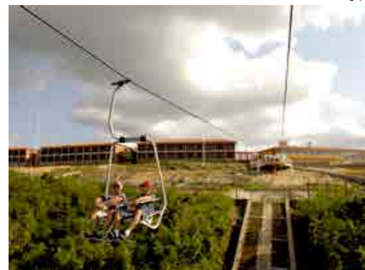
Teleférico foi o primeiro inaugurado na região Norte/Nordeste, em 2006