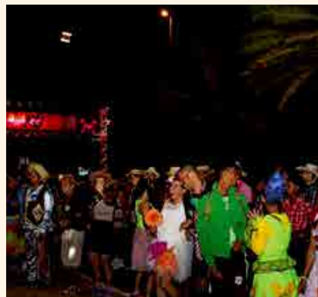
Corrida dos Namorados levou dezenas de casais para Orla