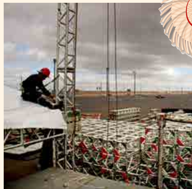
Estrutura de evento montada para receber 70 atrações