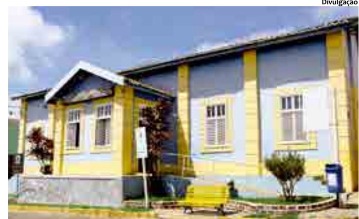
O museu está localizado na Rua Olímpio Wanderley, no Centro Histórico do município