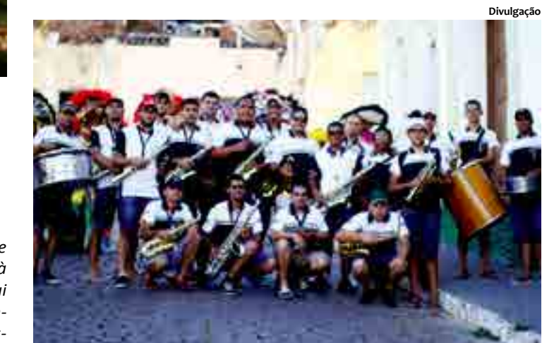
Apresentações culturais marcaram festa de emancipação da cidade