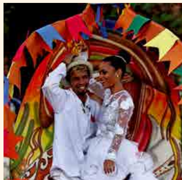
Concurso de Carroças aqueceu petrolinenses para o São João