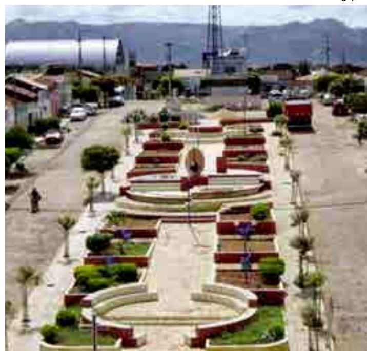
Quixaba é o penúltimo dos 10 melhores de PE