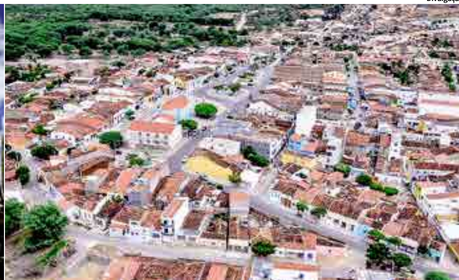
São José do Egito se destaca no 5º lugar do ranking