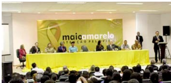
Campanha leva capacitações a professores da rede pública de ensino