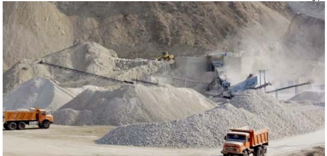
Das reservas do Polo Gesseiro são extraídas 2,8 milhões de toneladas da gipsita por ano, empregando cerca de 12 mil trabalhadores

Durante a terceira rodada do seminário Pernambuco em Ação, no último dia 05, foi anunciado um investimento de R$ 12 milhões na construção da Escola Técnica Estadual (ETE), em Exu