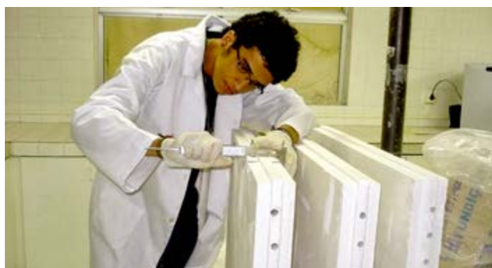
Sindusgesso defende cursos voltados para engenharia civil ou mecânica para a ETE