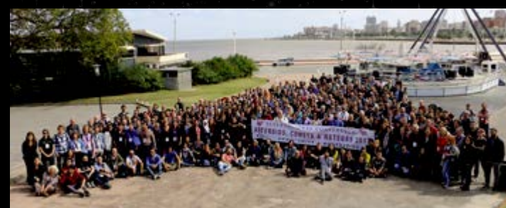
Evento realizado em Montevidéu reuniu centenas de astrônomos de vários países