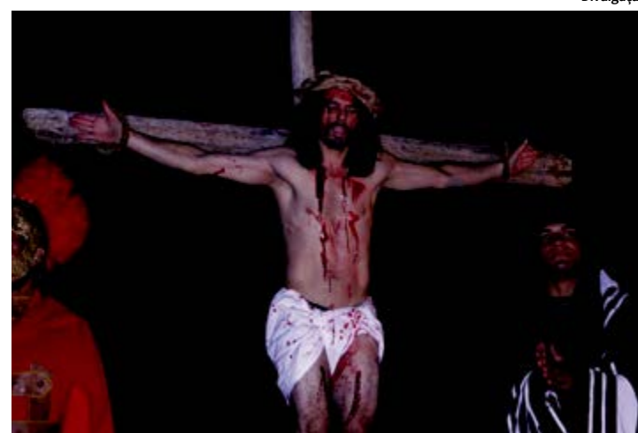
Espectáculo coloca em cena 120 pessoas, entre atores e figurantes