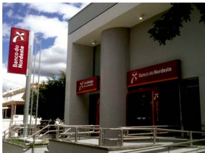
A agência de Salgueiro é uma das 40 unidades de atendimento no Estado