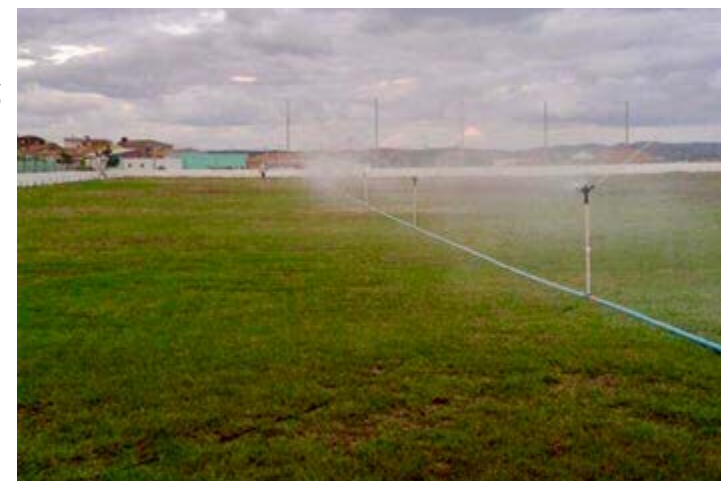
Estádio foi palco da vitória do time sertaniense na Copa do Interior de 2003

■ A Prefeitura de Sertânia inicia a reestruturação do Estádio Odilon Ferreira com uma série de intervenções, como a recuperação do gramado do equipamento. Além disso, a gestão municipal também reformará espaços como vestiários, arquibancada, alambrado e cabine de rádio. A iniciativa busca preservar o espaço com objetivo de ofertar mais uma opção de lazer para a população. O Estádio, inclusive, já foi palco de momentos especiais, como na Copa do Interior de 2003, quando o time sertaniense foi campeão.