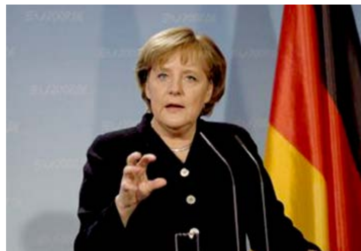
Chanceler alemã encontrará Trump pela primeira vez

O encontro entre os dois provavelmente vai contemplar uma variada gama de assuntos, incluindo a economia global, comércio, a luta contra o Estado Islâmico, a ONU e as relações com a Rússia e a China. Angela Merkel tinha boa relação com o antecessor de Trump, o democrata Barack Obama. JS