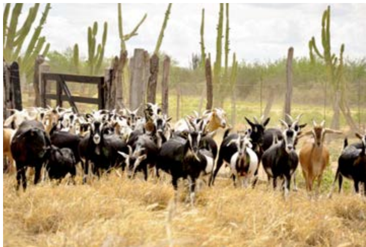
Ação visa aumentar a produção de leite de caprinos e ovinos

De acordo com a secretaria de Agricultura e Reforma Agrária, serão investidos R$ 5 milhões, por meio do BNDES. O projeto vai fomentar e fortalecer a cadeia e será executado ao longo de cinco anos. As primeiras atividades serão as oficinas