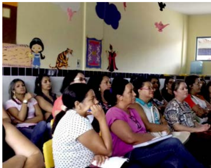
Capacitação foi realizada na Creche Municipal Dr. José Rabelo de Vasconcelos

A prefeitura também decidiu intensificar o atendimento aos alunos com necessidades especiais nutricionais, por causa de sua condição de saúde. “A minha preocupação é que a nossa merenda escolar possa atender a cada criança adequadamente. Por isso, foi feito um cardápio que é também encaminhado para os pais poderem fazer o acompanhamento”. Para obter este serviço diferenciado, os pais devem levar laudo médico e entregar aos gestores das escolas onde os filhos estão matriculados. JS