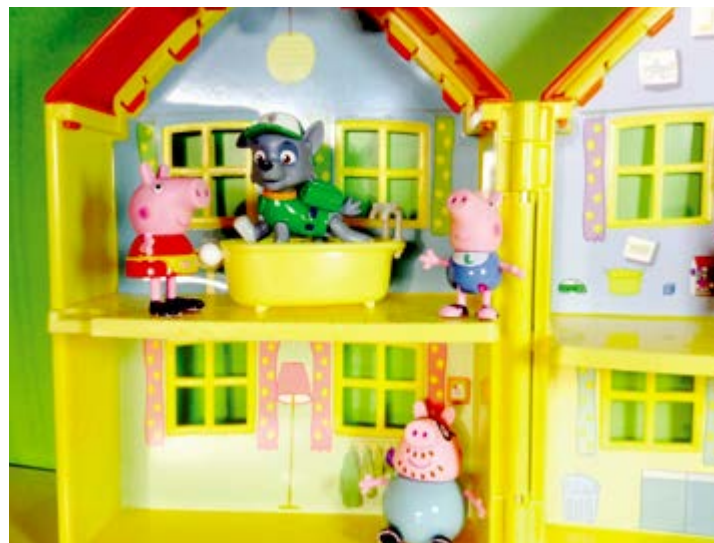
Equipamento será o primeiro do Brasil

Um projeto educativo inovador está surgindo em Arcoverde (PE); a instalação de uma brinquedoteca em plena feira livre do município. Essa será a primeira brinquedoteca do Brasil dentro de uma feira livre. A proposta apresentada tem o objetivo de atender às crianças que frequentam o Centro Comercial de Arcoverde (CECORA) aos sábados e domingos. De acordo com a prefeitura, a brinquedoteca foi pensada para ser um lugar de acolhimento às crianças filhas de feirantes e visitantes que normalmente frequentam esse espaço comercial. Segundo a prefeita Madalena Brito, “Esse será um espaço voltado para atender aos anseios de pais que não têm com quem deixar seus filhos, e afirma; A infância é prioridade no nosso go-