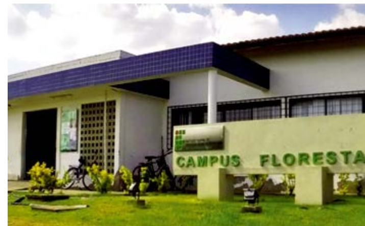
Evento será realizado no Campus IF- Sertão Floresta

Os alunos interessados em apresentar trabalhos sobre a temática Indígena e Quilombola no II Encontro GEDin Sertão, que acontece entre os dias 02 e 12 de maio já podem se inscrever. O envio de comunicações acadêmicas deve ser feito até o dia 31 deste mês. O grupo atua na região de Itaparica desde 2011 e é formado por professores e alunos, que vem desenvolvendo uma série de projetos de pesquisa e extensão com repercussão local, regional e nacional. O evento é gratuito.