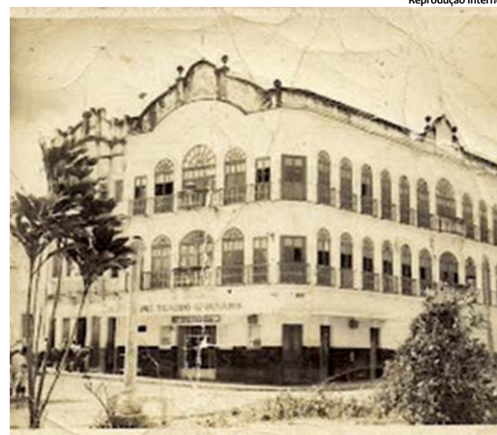
A arquitetura do Cine Teatro se destaca no cenário urbano