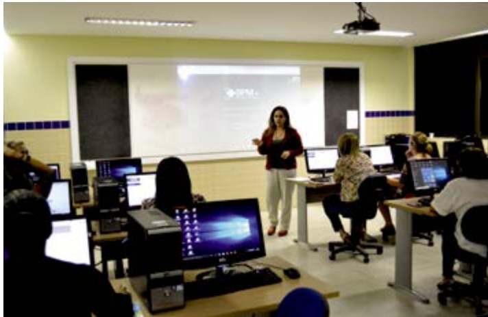
Aulas são ministradas na sede do Cefospe, no Recife

■ O Centro de Formação dos Servidores e Empregados Públicos do Estado de Pernambuco (Cefospe), disponibiliza 65 vagas para servidores municipais, especialmente gestores, em 13 cursos diferentes, para o mês de março. A iniciativa faz parte de um trabalho em conjunto do governo do Estado, através das Secretarias de Planejamento e Gestão (Seplag), de Administração (SAD), e da Associação Municipalista de Pernambuco (Amupe). Os primeiros cursos começarão a ser apresentados no dia 06/03 e seguem cronograma por todo o mês, com aulas até o dia 31, realizadas na sede do Cefospe, na Rua Tabira, s/n, Boa Vista, Recife. Entre os cursos ofertados pela instituição, estão os cursos de Gestão para Resultados no Setor Público e o Básico de Contratos Administrativos, além do curso de Noções Básicas de Marketing para Organizações Públicas, Introdução ao Manejo Sustentável de Águas Pluviais. De acordo com a Seplag, o objetivo da iniciativa é garantir que 10%