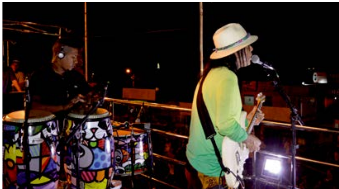
Os trios elétricos tomaram conta das ruas em Juazeiro

Festa contou com uma verdadeira mistura de ritmos, levando o tradicional axé baiano de Márcio Victor e Psirico e músicas sertanejas pelas ruas da cidade