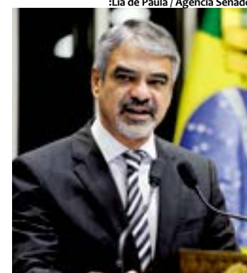
O Senador Humberto Costa critica indicação do ministro