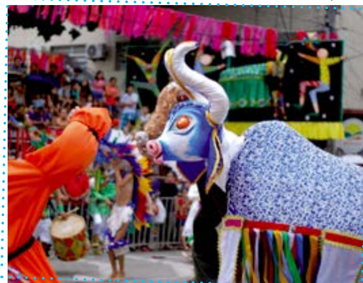
A Folia de Bois é uma grande tradição arcoverdense