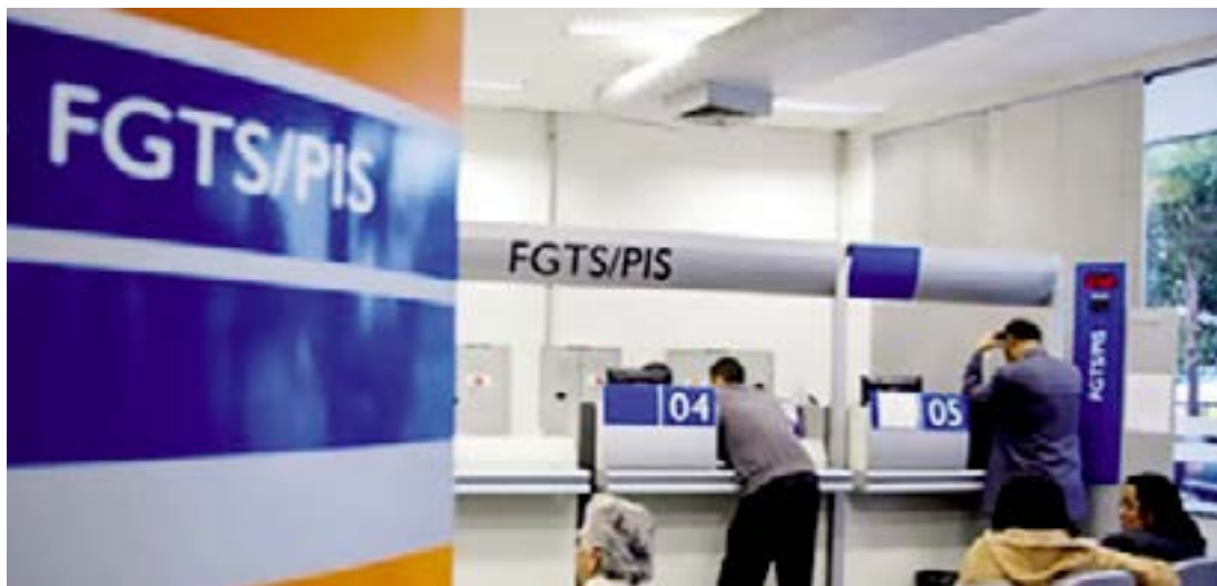
Agências abrem duas horas mais cedo para auxiliar beneficiários

Agências abrirão duas horas mais cedo para atender aos beneficiários que queiram saber o saldo ou retirar dúvidas. Os saques só poderão ser realizados entre 10 de março e 14 de julho