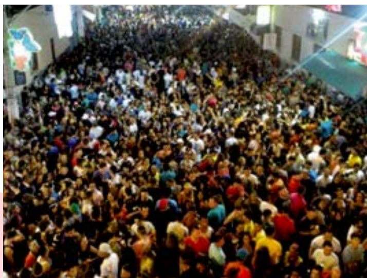
Milhares de foliões curtiram a programação de Carnaval