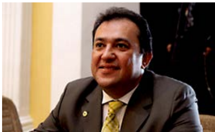
Sebastião agilizará sistema viário de acesso

De acordo com o secretário, a previsão é de que a obra de construção tenha início ainda em julho deste ano. O responsável pela execução da obra será