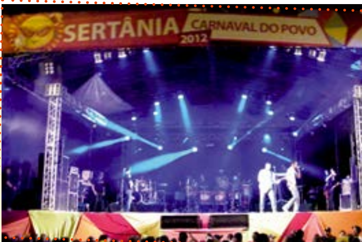
A festa é concentrada na Praça de Eventos Olavo Siqueira, no Centro