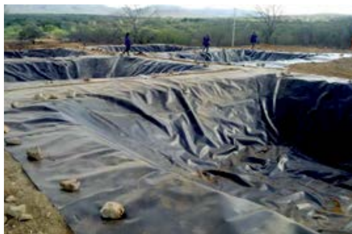
Tanques de geomembrana vão impermeabilizar o solo

Com investimentos de R$ 30 milhões, A Hertz do Brasil Participações Ltda, sediada no Rio Grande do Sul, inicia a construção da sua primeira Usina de Reciclagem de Lixo no Brasil. O local escolhido foi o município de Serra Talhada, no Sertão do Pajeú. A empresa já possui operação no Uruguai e chega à capital do Xaxado como objetivo de tornar o município a Capital da Reciclagem no Nordeste, com expectativa de gerar 700 empregos diretos.