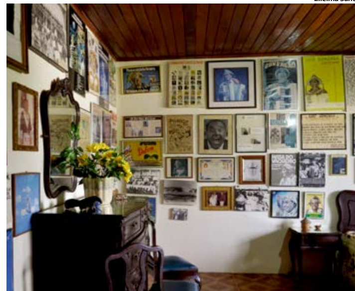
Mobiliário e peças permanecem na casa onde o Rei do Baião morou.