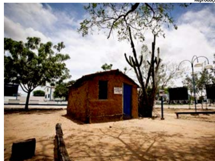
O Parque possui também uma réplica da Casa de Taipa onde o Rei do baião nasceu