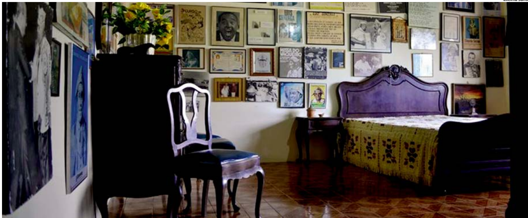
Mobiliário original foi todo preservado, do jeito que o Rei do Baião deixou. No museu, também estão disponíveis os chapéus, sandálias, gibão de couro e outros itens utilizados pelo artista