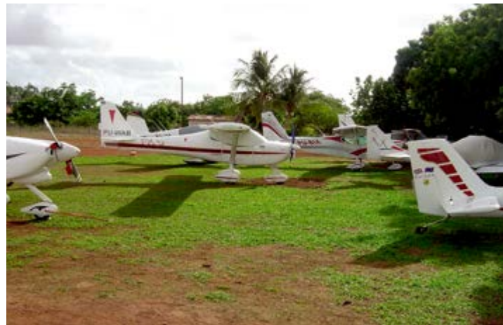
Pequenas aeronaves de outros Estados na pista da fazenda