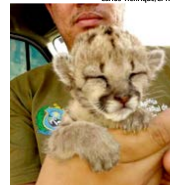
Filhote tem cerca de 20 dias