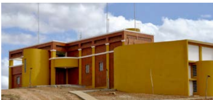
Enoteca está em fase de conclusão com previsão de entrega ainda em 2017

A produção de uva em Lagoa Grande gera 10 mil empregos diretos e indiretos e produz, anualmente, cerca de 20,5 milhões de quilos de uva. São exportados para o Brasil e para outros países sete milhões de litros de vinho. Estes números equivalem a 15% da produção nacional. O Vale do São Francisco é a única região do mundo que produz vinho o ano todo, já que possui irrigação e luz solar nos 365 dias do ano. Além de Lagoa Grande, também fazem parte da Rota do Vinho os municípios de Petrolina, Santa Maria da Boa Vista e Casa Nova, na Bahia. JS