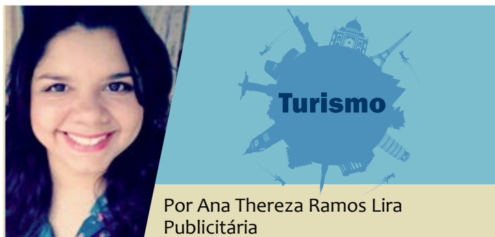
Por Ana Thereza Ramos Lira Publicitária