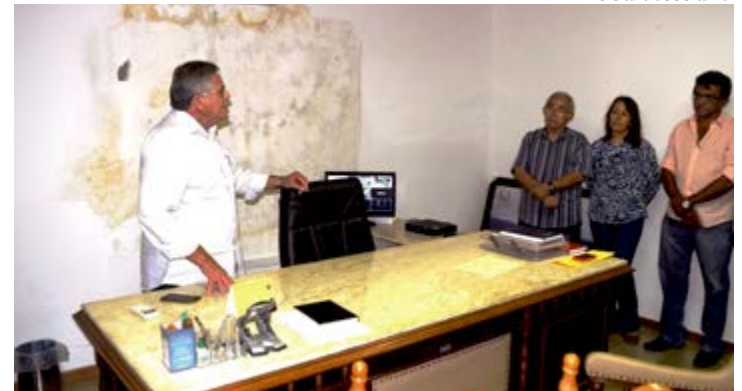
Prefeitura de Sertânia

assumir no futuro. É importante dizer que ainda não fechamos esse levantamento. Portanto, a dívida pode ser maior", complementou Miguel. Os atrasos salariais em Petrolina, segundo a prefeitura, foram encontrados nos setores da Saúde e Educação. "Já recebemos o Sindicato dos Servidores e informamos que as folhas salariais, que não foram pagas pela gestão passada, terão que ser negociadas e o que é de nossa responsabilidade será pago. Encontramos muitas dificuldades, inclusive a falta de pagamento de PASEP e outros direitos. Todas as medidas para regularizar os pagamentos e direitos dos servidores já estão encaminhadas e vamos trabalhar para reequilibrar essas contas o quanto antes", detalhou o prefeito.