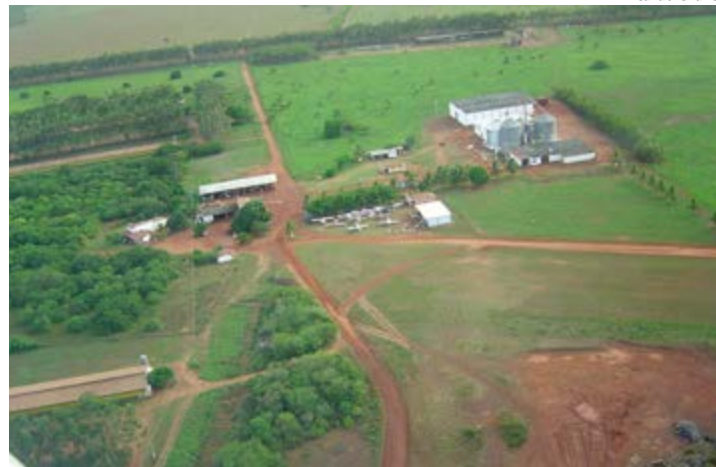
Fazenda Bebida Velha, no Rio Grande do Norte, é local de encontro