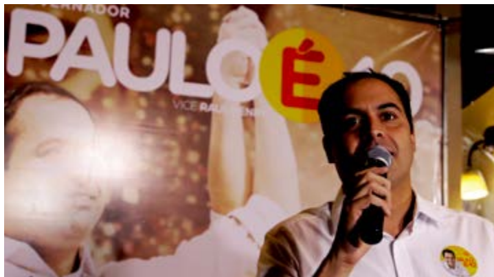
Projeto foi proposto ainda na campanha eleitoral, há dois anos