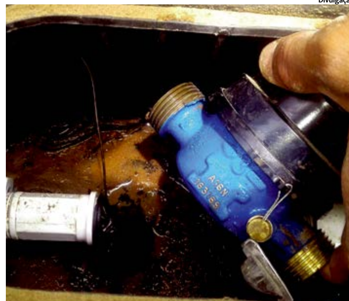
Irregularidades para não registrar consumo d'água, hidrômetros foram invertidos

mam 1,4 mil moradores. De acordo com a Compesa, os furtos de água na Adutora Maria Tereza Coelho também prejudicaram diretamente o abastecimento das cidades de Afrânio e Dormentes, onde as populações de 11 mil e 9,5 mil pessoas, respectivamente, enfrentam um rodízio de dois a três dias com água para dez dias sem. A adutora transporta água da Barragem do Reservatório 3 do Sistema de Irrigação Maria Tereza Coelho, em Petrolina, com uma vazão de 50 litros por segundo, e percorre 160 quilômetros até chegar em Dormentes e Afrânio. Segundo a Compesa, haverá aplicação de multa nas propriedades