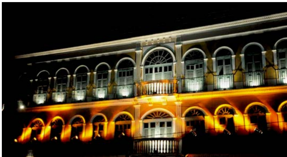
Paulo - Divulgação

Sessões são exibidas na Fábrica de Criação Popular. Iniciativa é do Sesc Pernambuco. Programação inclui produções infanto-juvenis e entrada é gratuita