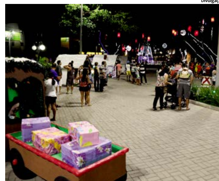
Crianças, jovens e adultos aproveitam a programação de Natal do município