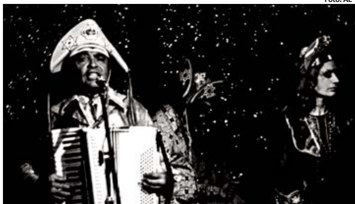
O sanfoneiro Luiz Gonzaga durante show em São Paulo, 1972

Depois de uma carreira no serviço militar, Luiz Gonzaga inicia, enfim, sua carreira no final da década de 1930. Em 1947, ele grava, em 78 rpm, o que se tornaria um clássico da música brasileira: ‘Asa Branca’, sua terceira parceria com Humberto Teixeira, inspirado no repertório de tradição oral nordestina. A partir desse ano, Luiz Gonzaga adota o chapéu de couro semelhante ao usado por Lampião, a quem tinha verdadeira admiração, assumindo a identidade nordestina no cenário nacional. Seria, então, a consolidação de uma grande carreira musical, repleta de várias outras obras gravadas em parceria com outros compositores, tais como ‘Pagode Russo’, ‘Feira de Caruaru’ e ‘Danado de Bom’.