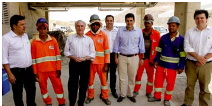
Temer em Surubim, ao lado de funcionários da unidade, do governador Paulo Câmara e dos ministros do governo

Durante a visita ao Reservatório Salgueiro, Temer destacou o estágio avançado da obra. "Estou entusiasmado com o ritmo das obras. É uma satisfação saber que nosso projeto de tentar