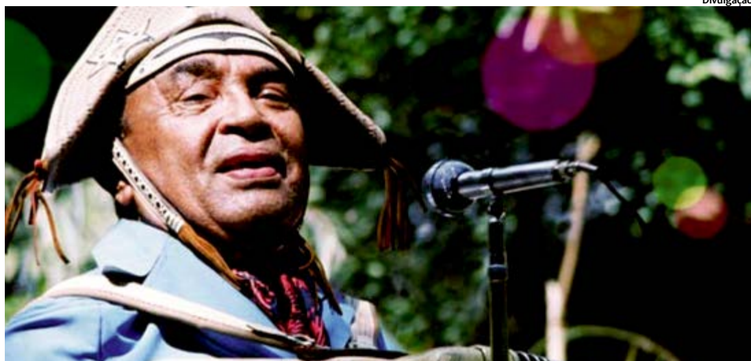
O Rei do Baião e o chapéu de couro, inseparável acessório que ele levou por toda carreira, como símbolo da cultura nordestina