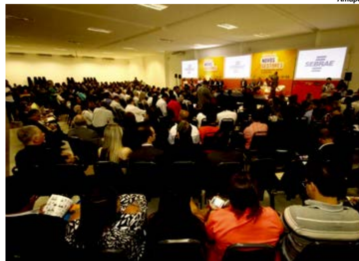
Seminário da Amupe contou com mais de 800 participantes

Na oportunidade, o governador fez importantes anúncios, como a renovação do Plano de Combate às Doenças Transmitidas pelo Aedes aegypti e assinou o decreto que prorrogou a Situação de Emergência em Saúde por mais 180 dias. “Os prefeitos eleitos e reeleitos têm o desafio muito grande de trabalhar pelo seu município em um momento de crise econômica tão difícil. Então, a gente se prontifica a continuar com as parcerias e a buscar soluções. Os enfrentamen-