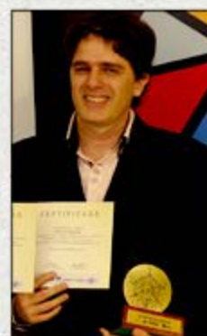
AVELOZ CRIATIVA Recife Destaque de Responsabilidade Social