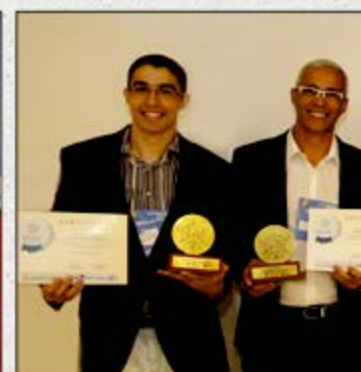
VELHO CHICO PLAZA HOTEL Petrolina Categoria Serviços de Turismo e Destaque de Responsabilidade Social