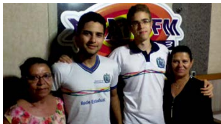
Alunos concederam entrevista à rádio da cidade para compartilhar a experiência com a comunidade

A QUANTA é uma competição anual de ciências, matemática, habilidade mental e eletrônica, realizada pela City Montessori School (CMS) que inclui competições com debates, quizzes, testes de habilidade mental e desafios. JS