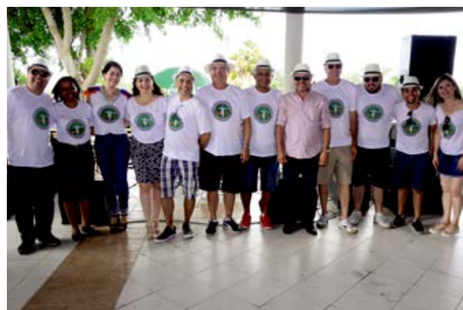
A direção e staff da festa Boteco 25, a confraternização de fim de ano da Unimed Vale do São Francisco, na Chácara Boungainville em Juazeiro/BA.