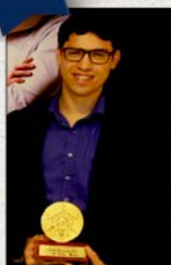
RISHON COSMÉTICOS Recife Categoria Indústria