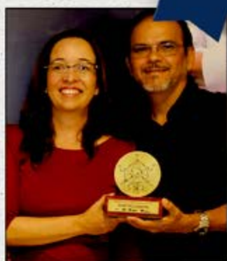
ATALAIA TURISMO Fernando de Noronha Categoria Serviços de Turismo

Estas empresas se destacaram em qualidade, produtividade e competitividade.