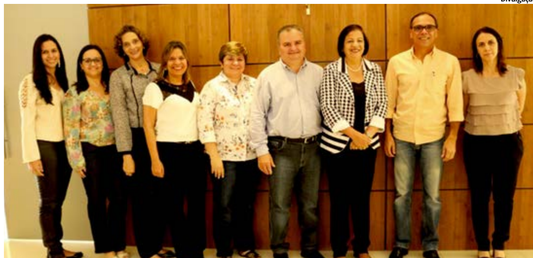
Secretário de Saúde Iran Costa visitou unidades de saúde ao lado da prefeita Madalena Brito

O secretário estadual de Saúde, Iran Costa, cumpriu agenda em Arcoverde, Sertão do Moxotó, no último dia 14, para conferir o atendimento no Hospital Regional Ruy de Barros Correia, ouvir as demandas e anseios dos profissionais da rede estadual, além de se reunir com os gestores locais. A cidade é sede da VI Gerência Regional de Saúde, que engloba 13 municípios e uma população de mais de 400 mil habitantes. O Hospital do município teve sua administração, recentemente, compartilhada com o Hospital Tricentenário. A mudança proporcionou incremento nos atendimentos de partos em 60%.