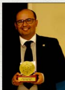
SERCON Arapirina Categoria Serviços