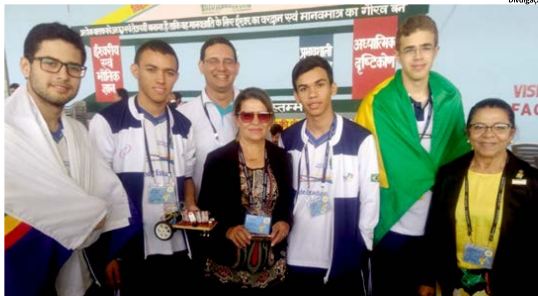
Após a classificação, os alunos comemoraram conhecendo o cartão-postal da Índia, o Taj Mahal

■ Cinco estudantes do 3º ano da Escola de Referência Josias Inojosa de Oliveira, localizada na Vila Santa Izabel, em Araripina, participaram da 22ª Edição da QUANTA – Olimpíada Internacional de Matemática, Ciências e Robótica e foram classificados entre os oito melhores do mundo na categoria matemática. A competição, realizada entre 17 e 20 de novembro, aconteceu em Lucknow, na Índia, e os jovens ficaram em 1º lugar entre as 14 equipes que representaram o Brasil no continente asiático. A disputa contou com mais 26 países no torneio, e 78 equipes disputavam medalhas.