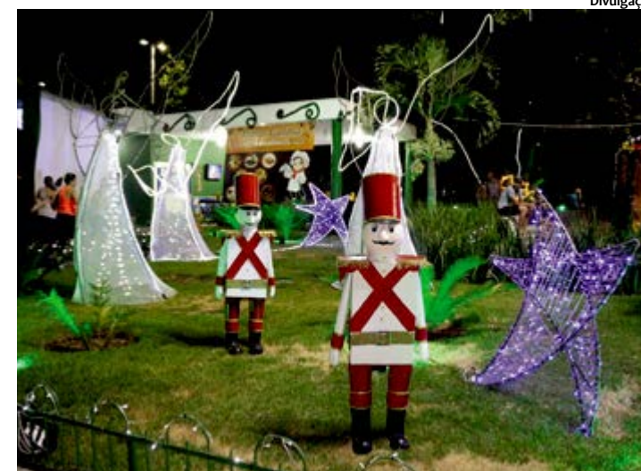
A praça ganhou decoração com peças natalinas e iluminação especial

ga. No dia 18, apresentaram-se o grupo de Idosos da Casa 60+, a Filarmônica Berlamino Duarte e o grupo da Fundação Terra. O Natal de Coração foi lançado, em 2013, pela prefeita Madalena Britto e acontece durante todos os finais de semana do mês de dezembro. De acordo com a prefeitura, neste ano, menos recursos foram empregados, contando com apoio de secretarias municipais, igrejas católicas e evangélicas. “O que importa é celebrarmos o nascimento do menino Jesus e ofertarmos ao nosso povo a oportunidade de comemorar com a família um momento tão especial”, enfatizou Madalena.