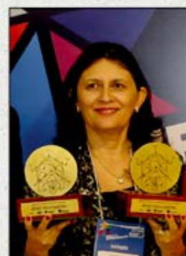
LAGAM - LABORATÓRIO DE ANÁLISES MÉDICAS Garanhuns Categoria Serviços de Saúde e Destaque de Inovação