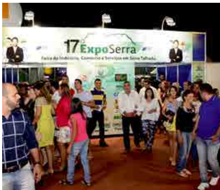
A expectativa da CDL é que a feira conte com cerca de 250 expositores

pregos diretos e indiretos. A exposição, criada no ano 2000, começou como uma pequena feira de negócios local. Com a parceria firmada entre prefeitura, governo estadual, Sebrae, AD Diper, Empetur, Banco do Brasil, Banco do Nordeste, Caixa e outras empresas privadas e entidades públicas, o evento foi crescendo ao longo das últimas 17 edições, tornando-se uma das maiores feiras do gênero do interior do Nordeste. JS