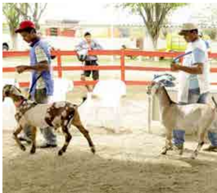
Concurso de peso para caprinos e ovinos movimentou o Parque de Exposições

mil em prêmios ao campeão. De acordo com o secretário, haverá ainda o Primeiro Leilão Berço do Anglo, no sábado (08), às 19h. Além disso, no domingo (09), um concurso de peso para caprinos e ovinos movimentará o Parque de Exposições. Ao todo, o evento concederá cerca de R$ 60 mil em prêmios para os participantes, de acordo com o vice-prefeito. “A nossa expectativa, como também a dos criadores, é muito boa. Sertânia tem um Parque de Exposição que conta com uma das melhores estruturas do Estado de Pernambuco. Temos a previsão de receber muitos criadores do Nordeste e o volume de animais deverá ser o maior dos últimos anos”, avalia Antônio. A organização oferecerá, pela primeira vez, alimentação aos tratadores dos animais. JS