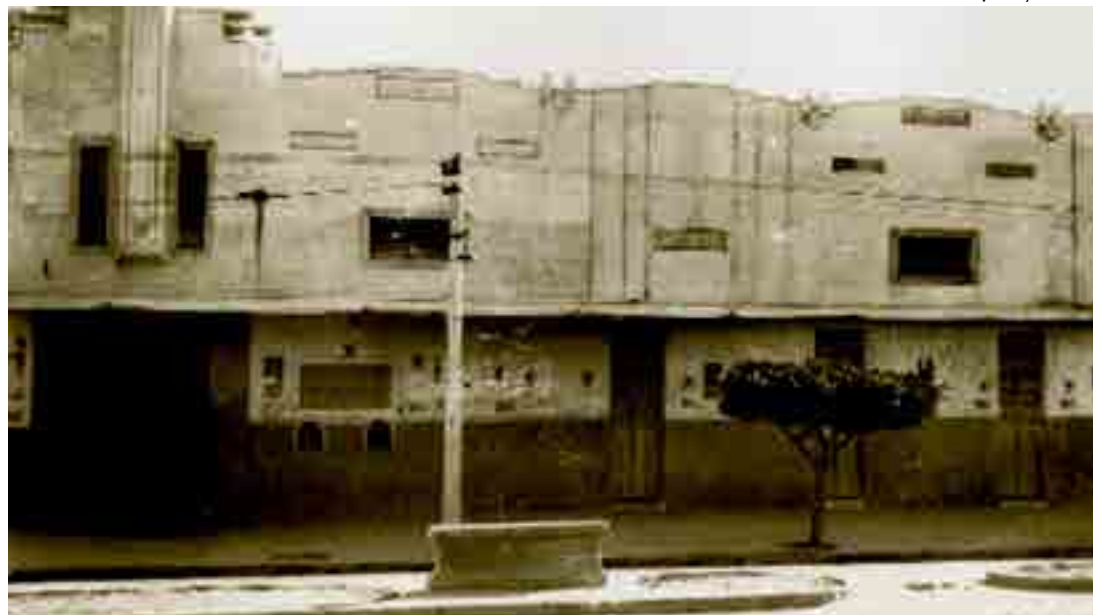
Na época da inauguração do Cinema Rio Branco, em 5 de maio de 1917, o espaço era um dos três prédios do antigo distrito