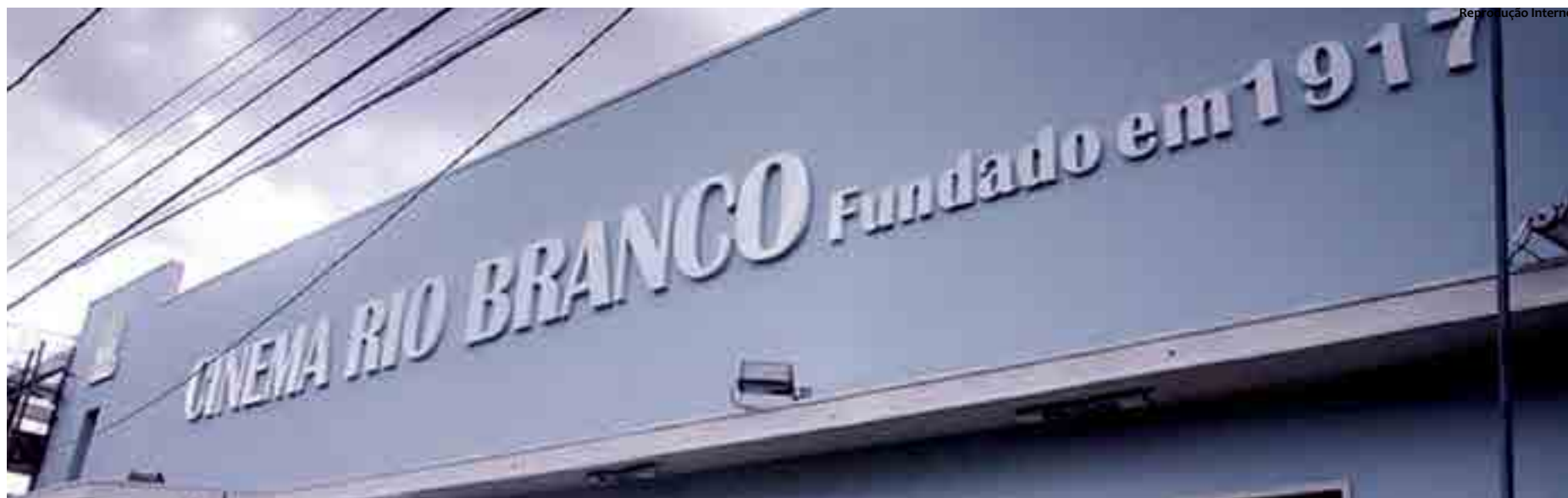
Uma parceria trará filmes de artes e comerciais, nos mesmos moldes do Cinema São Luiz, localizado no Recife. A programação de sessões será divulgada em julho. Os ingressos das sessões custam entre R$ 10 e R$ 5