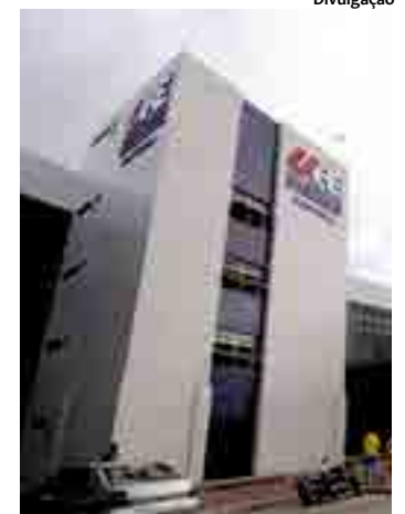
Salários chegam a R$ 7.514,74