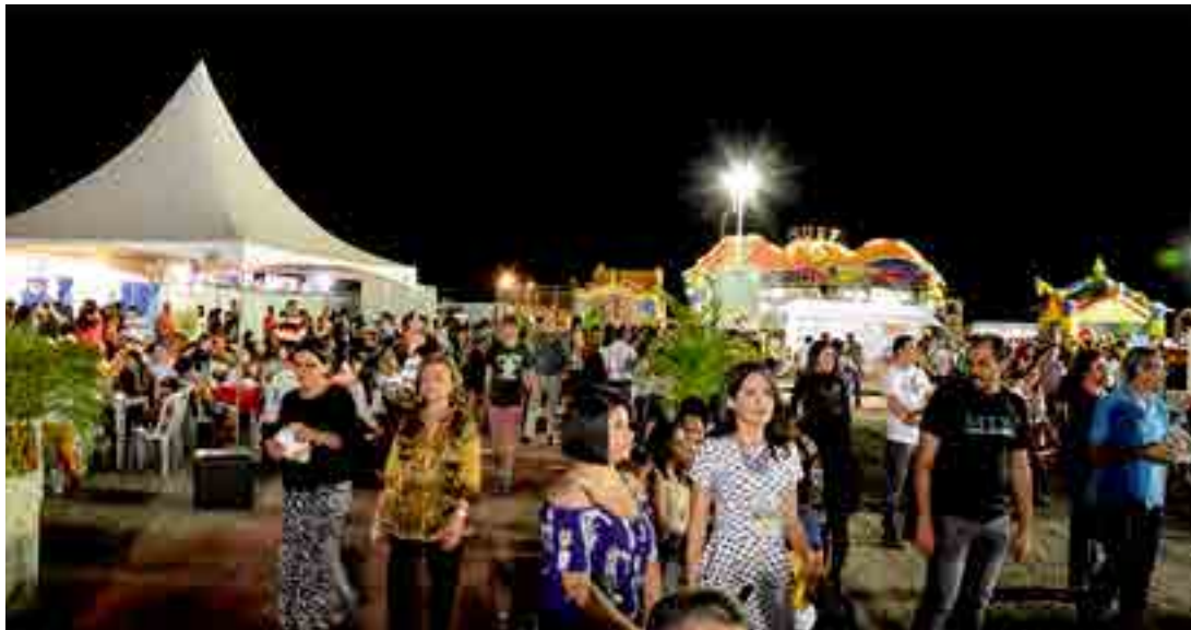
Além de atrair empresas e expositores, a Exposerra também aquece a economia nos setores hoteleiros e gastronômicos

A expectativa é de que a feira reúna 250 expositores. De acordo com a CDL, o evento aquece os setores hoteleiro e gastronômico, lotando a rede hoteleira da de Triunfo