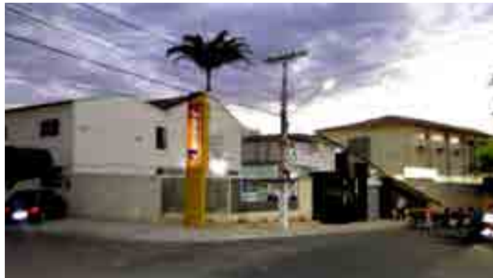
Candidato deve levar documentação à Comissão do processo seletivo

Com inscrição presencial, o candidato deve entregar a documentação à Comissão da Seleção Pública Simplificada em sala específica localizada na Avenida Afonso Magalhães, 380, no Centro de Serra Talhada, das 16h30 às 21h30. Os documentos necessários para concorrer às vagas estão disponíveis no site ( www.aeset.edu.br ). De acordo com a instituição, são 22 vagas para Pro-