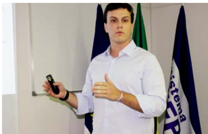
Gestor sugere criação de conselho para discussão de políticas organizacionais

Na reunião realizada no último dia 20, com foco na discussão de políticas que possam contribuir para o desenvolvimento de Petrolina e obter recursos