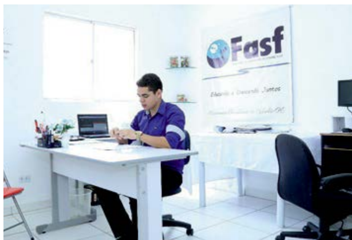
Serão ofertados inicialmente dois cursos com 100 vagas anuais