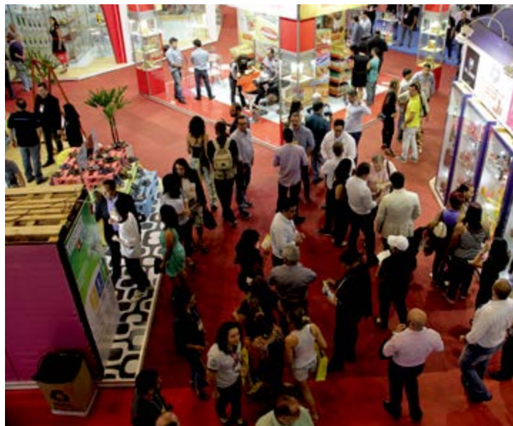
A 13ª edição da Super Mix ocorre em agosto na RMR

A 13ª edição da feira de negócios Super Mix ocorrerá entre os dias 21 a 23 de agosto, no Centro de Convenções, em Olinde. A Associação Pernambucana de Atacadistas e Distribuidores (Aspa), realizadora do evento, espera atrair mais de 25 mil visitantes – cinco mil a mais que em 2017 – nos 10 mil metros quadrados que serão ocupados do pavilhão do Local. O evento é direcionado à representantes de grandes ou pequenos negócios, além de interessados na área alimentícia. A organização espera também colaborar com a geração de negócios, demonstração de novos produtos, tendências e soluções para o setor. JS