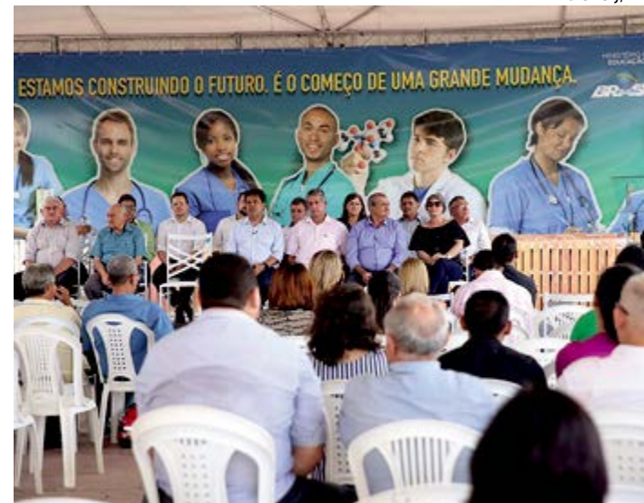
Serão ofertados os cursos de ciências da computação e engenharia de produção