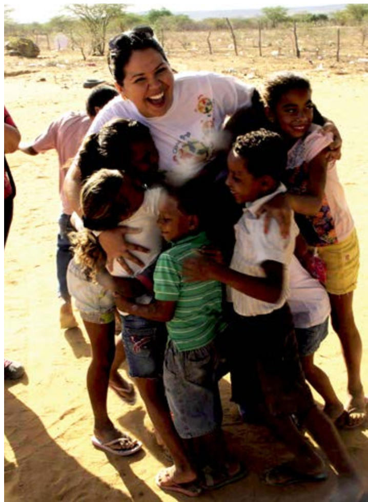
As crianças atendidas pelo projeto vivem em situação de vulnerabilidade