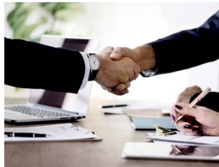
Governo espera crescimento econômico de 3% para 2018