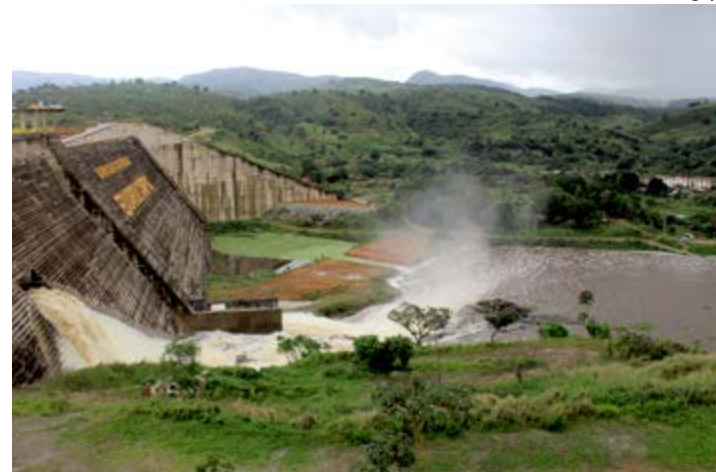
A obra levará um ano e meio para ser concluída

O Agreste pernambucano sofre com o sétimo ano consecutivo de seca. Com a estiagem alguns reservatórios operam com nível bem abaixo da média. Para amenizar a situação a obra da Adutora de Serro Azul tem estimativa de beneficiar 800 mil pessoas em dez cidades da região. De acordo com a Companhia Pernambucana de Saneamento (Compesa), a previsão é que a ordem de serviço da obra seja assinada ainda este mês pelo Governador Paulo Câmara.