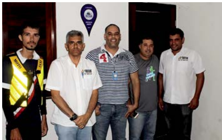
A reunião contou com representantes de ambos os lados

Os interessados em participar dos cursos e serviços de saúde disponibilizados em Arcoverde ou municípios próximos devem se dirigir de segunda a sexta-feira, das 9h às 13h, à sede da Arcotrans. O órgão fica localizado na Rua José Lins de Siqueira Brito, 64, no Centro. Para mais detalhes, acesse o Portal do Empreendedor através do site www.portaldoempreendedor.gov.br .