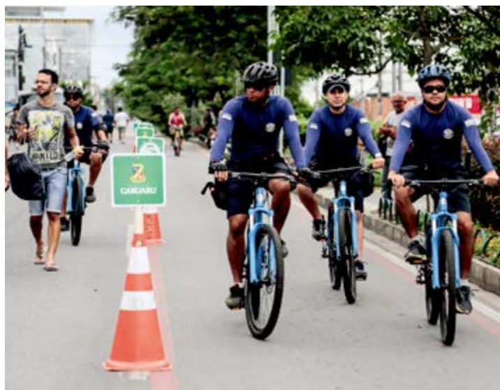
São oferecidos os serviços de aferição de pressão aos usuários da ciclofaixa do projeto

direcionadas à divulgação e orientação dos serviços oferecidos. O “Nossa Avenida” avenida tem conquistado o público local, que passa a ter semanalmente um espaço definido para realização de atividades de lazer e cultura com o suporte da Prefeitura de Caruaru, envolvida inclusive com a segurança do local onde se realiza os eventos.