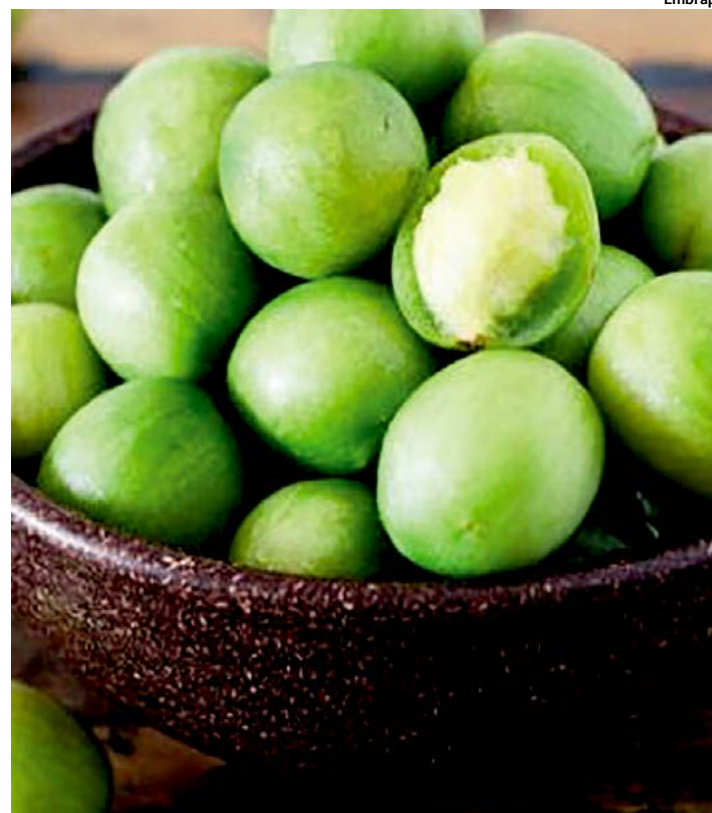
Pesquisador cita mais de 2.5 mil espécies de plantas existentes na natureza

natural. Não há espaço para valorizar os atributos de qualidade dos nossos autóctones, como se faz no mundo inteiro” afirma o pesquisador. Segundo Clóvis, a valorização dos produtos locais é, no contexto da globalização, o grande instrumento estratégico para alcançar os objetivos principais de preservar os recursos da Caatinga e assegurar, ao mesmo tempo, um padrão de vida condigno para as populações que nela vivem e dela dependem. “Produtos diferenciados, a partir da incorporação de uma identidade territorial e cultural, constituem uma alternativa de grande potencial no Semiárido. É simplesmente uma questão de um pouco mais de esforço em conhecer melhor o que temos e do que dispomos”, defende o pesquisador. JS