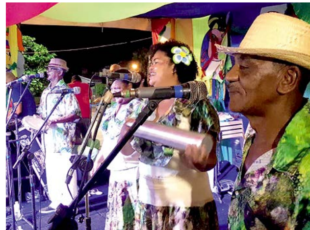
Festa tradicional foi até a quarta-feira de cinzas

Os Bois, Ursos e Similares participaram do concurso com apoio da Prefeitura de Arcoverde, por meio das subvenções. Foram 20 agremiações que disputaram os grupos de Acesso, Ursos e Especial. “Em cima da problemática de toda esta crise que a cidade vem atravessando, o Carnaval de Arcoverde demonstrou o quanto é competente e diversificado,