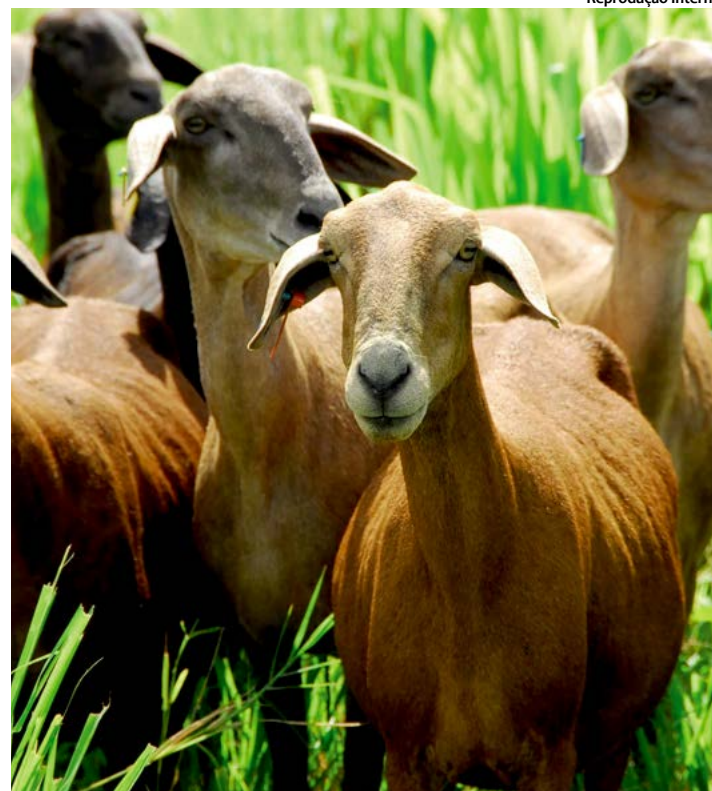
A caprinocultura é um dos segmentos que pode ter a exploração ampliada