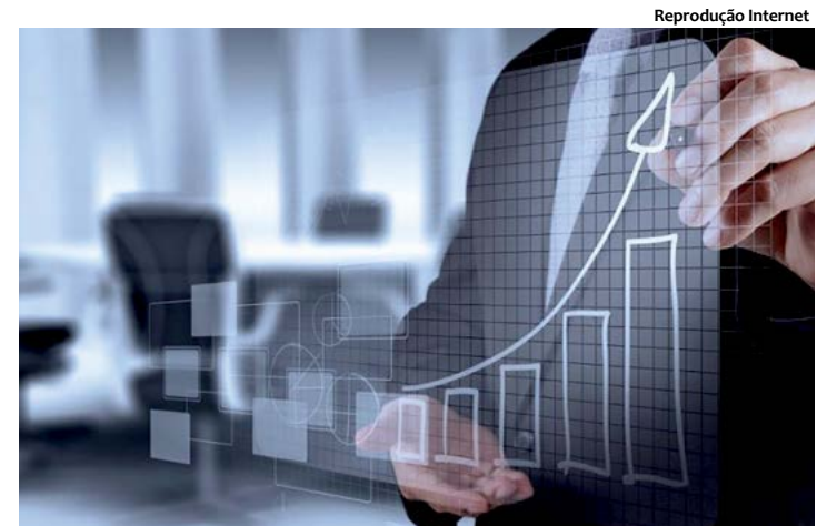
Entrevistados acreditam que condição financeira vai melhorar em 6 meses

De acordo com a Agência Brasil, mais da metade dos 801 consumidores ouvidos (59%) demonstraram expectativa de melhora de sua condição financeira nos próximos seis meses. Para 21%, as pessoas estão comprando mais, e 20%