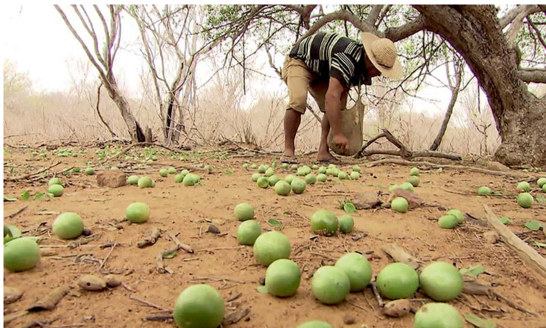
O Umbu é um dos produtos do semiárido que pode ser melhor explorado