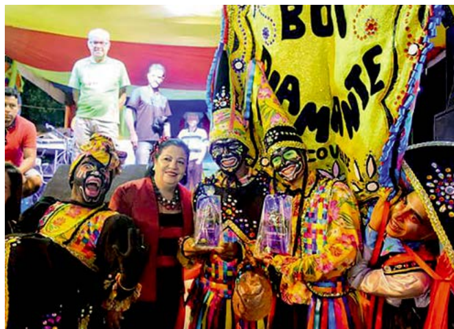
Grupo campeão alcançou 270 pontos na competição

O Boi Diamante foi o grande vencedor do Carnaval de Arcoverde com 270 pontos. O Boi Fantástico foi o vice-campeão com 263 e Boi Estrelinha ficou com o terceiro lugar e